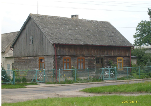
Drewniany dom z połowy XIX w.