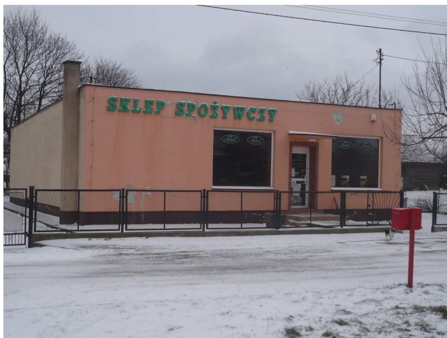
Nowoczesny sklep w centrum Wałdyk

Obok wybudowano nowy, estetyczny sklep, który zaspokaja codzienne potrzeby mieszkańców. Zarówno budynki po „starej” szkole jak również sklep znajdują się w centrum wsi. Tam również mieści się plac zabaw dla dzieci.