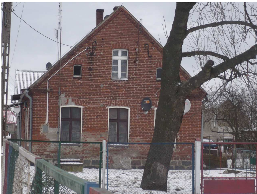
Stara szkoła w Wałdykach