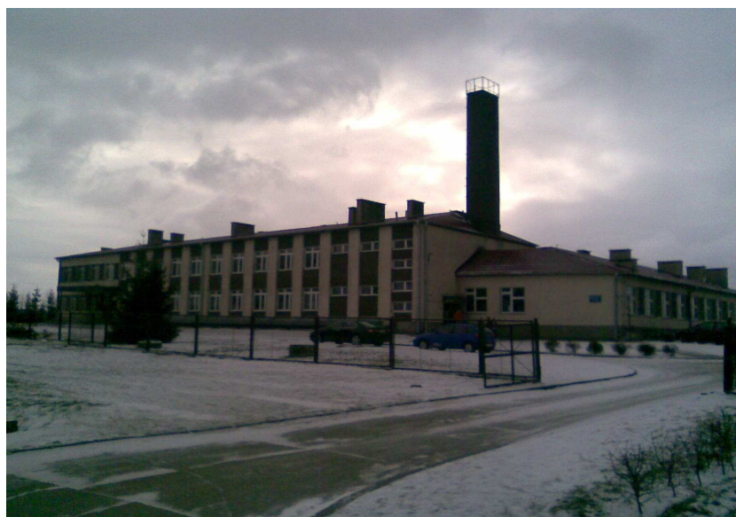
Zespół Szkół Wałdyki- Grabowo

Zespół Szkół Grabowo-Wałdyki dysponuje w miarę dobrym zapleczem sportowym. Choć niewielka ale znajduje się tu sala gimnastyczna /12m x 24m/, siłownia, salka do gimnastyki korekcyjnej i kompleks boisk, który wymaga jednak modernizacji i rozbudowy aby spełniał wymogi bezpieczeństwa. Boisko do piłki nożnej wymaga wymiany nawierzchni, a teren pod budowę kompleksu małych boisk to tylko plac i dwie bramki. Boiska w latach 90-tych, mieszkańcy wsi wykonali w czynie społecznym.