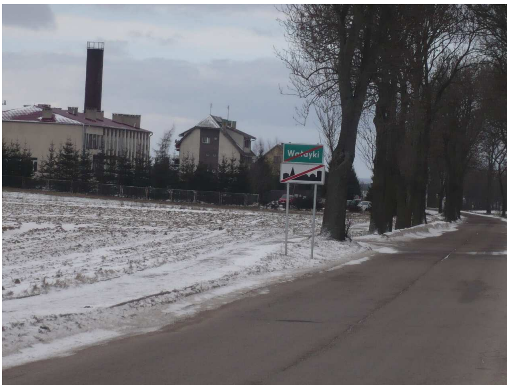
Zespół Szkół Wałdyki- Grabowo od strony Wałdyk