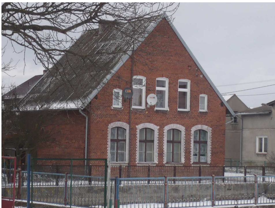
Szkoła w Wałdykach zbudowana około 1822 roku (obecnie budynek mieszkalny)

Obok wybudowano nowy, estetyczny sklep, który zaspokaja codzienne potrzeby mieszkańców. Zarówno budynki po „starej” szkole jak również sklep znajdują się w centrum wsi. Tam również mieści się plac zabaw dla dzieci.