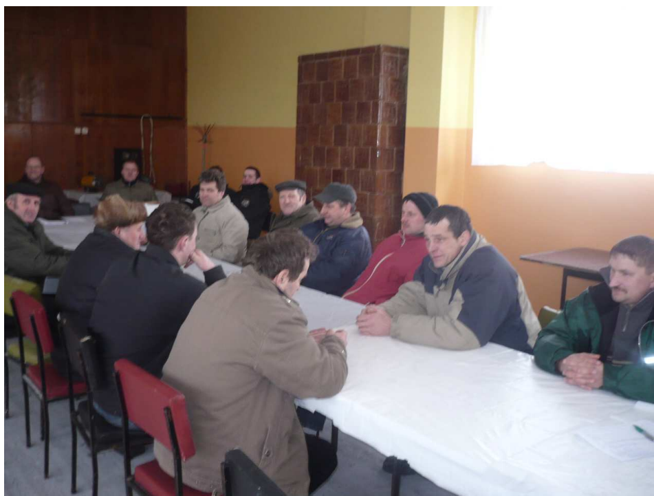
Mieszkańcy aktywnie uczestniczyli w opracowaniu Planu Rozwoju Miejscowości Wałdyki

Funkcje edukacyjne, kulturalne i religijne spełniane są dzięki bliskiemu sąsiedztwu z Grabowem. Wspólny zespół szkół oraz parafia w Grabowie zaspokajają wiele potrzeb mieszkańców Wałdyk.