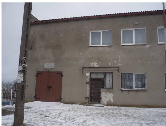
Remiza i świetlica w Wałdykach

Na terenie Gminy znajduje się Posterunek Policji.