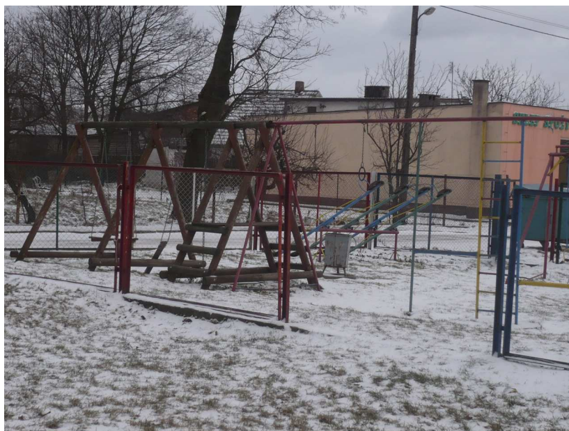
Plac zabaw w centrum wsi Wałdyki