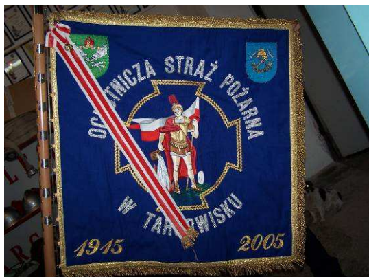
Sztandar OSP z okazji 90-lecia

W Targowisku działa Ochotnicza Straż Pożarna (OSP) o bardzo bogatej tradycji. W roku 2005 OSP świętowała 90-ciolecie istnienia. Już od lat przedwojennych OSP stanowiła Targowisku centrum życia wiejskiego Organizowała zajęcia i zawody dla dzieci, młodzieży i dorosłych, bale, festyny itp. Obecnie jednostka zrzesza 23 członków czynnych, 10 członków młodzieżowej drużyny żeńskiej i 10 drużyny męskiej w wieku do 16 lat.