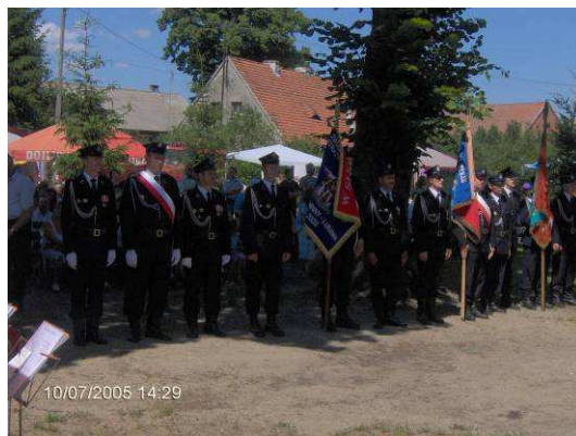
Obchody 90-lecia OSP

Co roku z inicjatywy OSP odbywa się Tydzień Strażacki . W tym czasie drużyny przygotowują się do zawodów gminnych i powiatowych. Na tym polu jednostka ma duże osiągnięcia – przez 10 lat czterokrotnie zajmowała I miejsce i jeden raz II miejsce w Gminnych Zawodach Sportowo-Pożarniczych, a w zawodach powiatowych – IV miejsce. Po Tygodniu Strażaka – 4 maja, obchodzone jest Święto Strażaka .