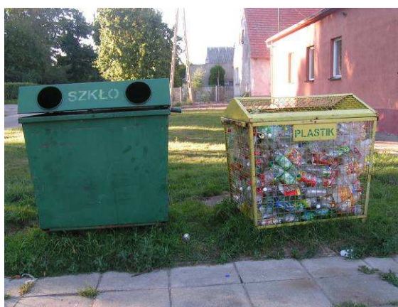
Jedno z trzech stanowisk do selektywnej zbiórki odpadów

W Targowisku stosuje się selektywną zbiórkę odpadów. Na terenie wsi stoją pojemniki na szkło i plastik. Są trzy stanowiska, ale zdaniem mieszkańców powinny być jeszcze dwa.