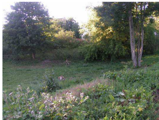
Teren nad rzeką Elszka pod przyszły amfiteatr

Pod względem historycznym, geograficznym i przyrodniczym obszar, na którym położona jest wieś nazywany jest Ziemią Lubawską.