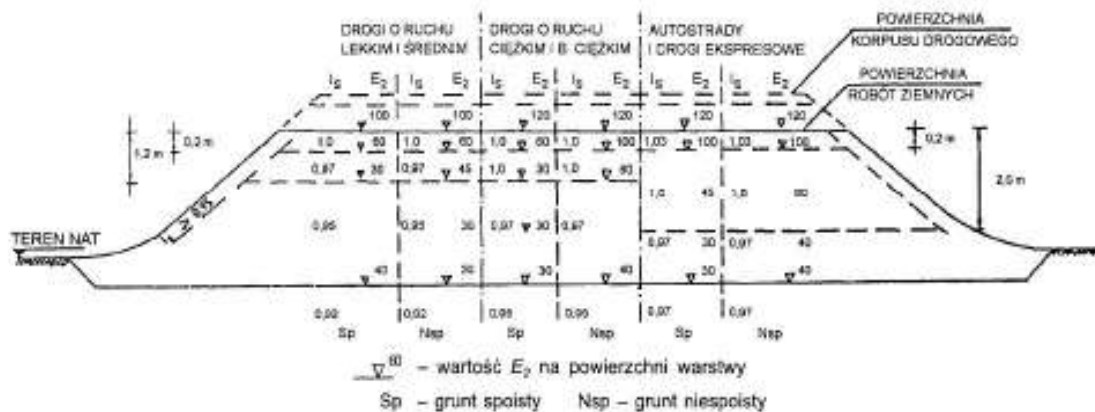
Rysunek 3 – Wartości wymagane w nasypach: wskaźnika zagęszczenia I_s i wtórnego modułu odkształcenia E_2 , megapaskali