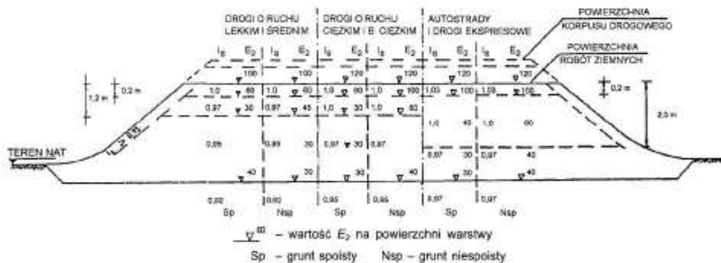
Rysunek 3 – Wartości wymagane w nasypach: wskaźnika zagęszczenia I_s i wtórnego modułu odkształcenia E_2 , megapaskali

Dodatkowo można sprawdzić nośność warstwy gruntu podłoża nasypu na podstawie pomiaru wtórnego modułu odkształcenia E_2 zgodnie z PN-02205:1998 [4] rysunek 3.