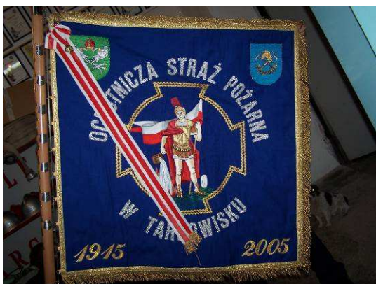
Sztandar OSP z okazji 90-lecia

W Targowisku działa Ochotnicza Straż Pożarna (OSP) o bardzo bogatej tradycji. W roku 2005 OSP świętowała 90-ciolecie istnienia. Już od lat przedwojennych OSP stanowiła Targowisku centrum życia wiejskiego Organizowała zajęcia i zawody dla dzieci, młodzieży i dorosłych, bale, festyny itp. Obecnie jednostka zrzesza 23 członków czynnych, 10 członków młodzieżowej drużyny żeńskiej i 10 drużyny męskiej w wieku do 16 lat.