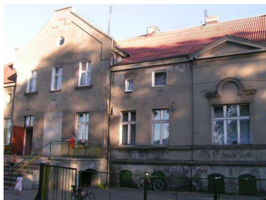
Dawny pałac i szkoła. Obecnie mieszkania komunalne.

W lipcu i sierpniu 2006 r. Rada Sołecka zrealizowała projekt pn. „Wakacje z historią i przyrodą Ziemi Lubawskiej”. Były to zajęcia warsztatowe oraz wycieczki krajoznawcze dla ok. 60 dzieci i młodzieży z sołectwa. Dzięki temu przedsięwzięciu: