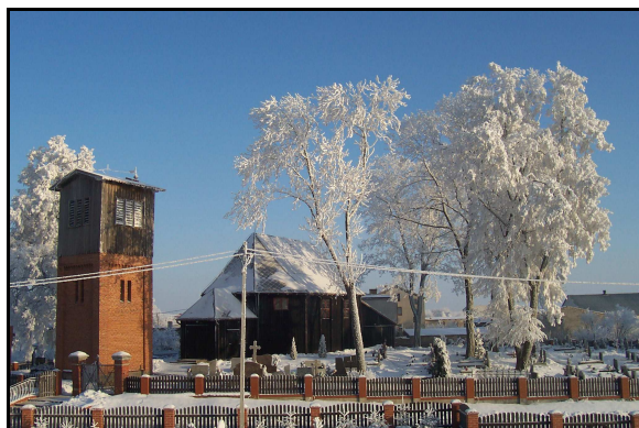
Zabytkowy kościół z 1725 r.