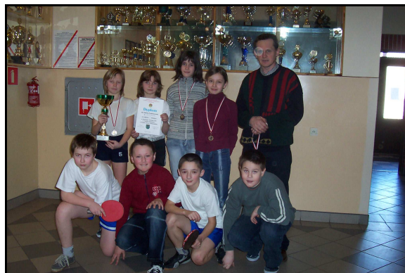
Najlepsi tenisści ze Złotowa.

Sprawa zagospodarowania czasu wolnego dla pozostałej części młodzieży należy do spraw priorytetowych Złotowa. W ramach tego programu należy część środków przeznaczyć na ten cel.