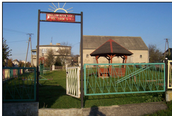
Plac zabaw dla dzieci.