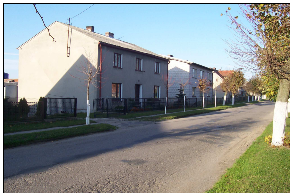
Nowe domy w Złotowie.

Złotowo w trakcie swej drogi przez zmienne dzieje stało się miejscowością o własnych, silnych tradycjach religijnych, kulturowych, patriotycznych, gospodarczych, sportowych, umiejącą działać wspólnie dla dobra lokalnej społeczności. Duży wpływ na to miała długotrwała historyczna przynależność do dóbr biskupich stwarzających ku temu odpowiednie warunki, jak i silne osobowości życia złotowskiego.