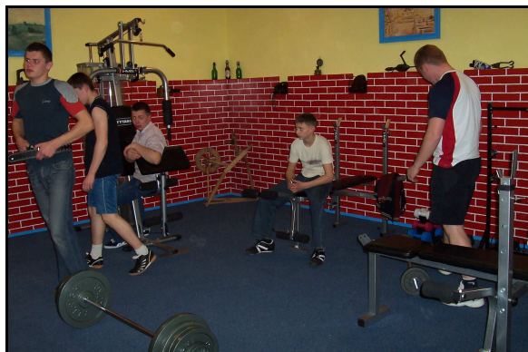
Zajęcia młodzieży w siłowni.