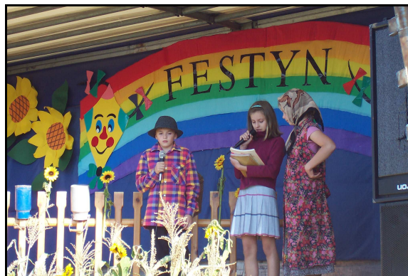
Rodzinny Festyn Dożynkowy.