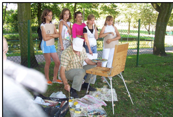
Młodzi artyści podczas pleneru malarskiego.