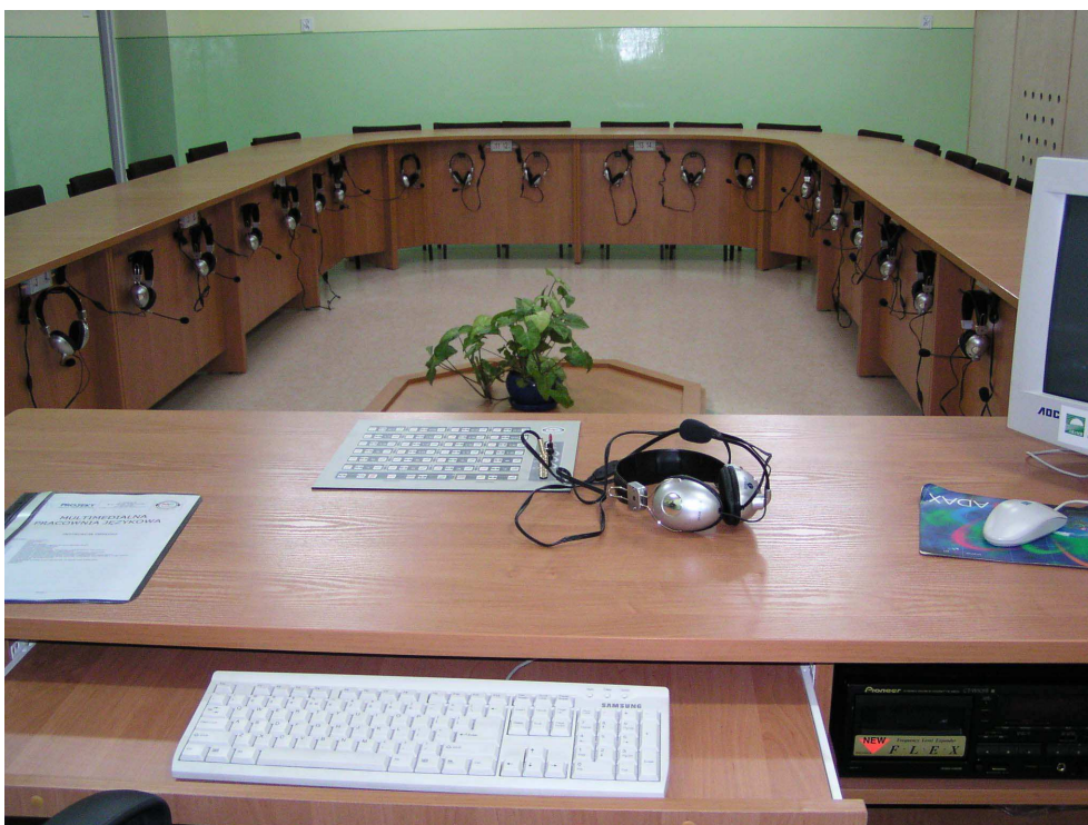
Przykład biurka ucznia i nauczyciela

Dotyczący przetargu nieograniczonego na „Wyposażenie 9 szkół wiejskich Gminy Lubawa w sprzęt i pomoce dydaktyczne celem utworzenia interaktywnych klas językowych”.