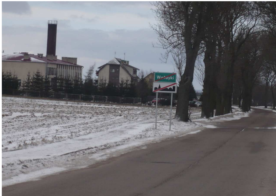
Szosa z Wałdyk do Grabowa(po lewej planowany chodnik)

się bardzo atrakcyjny dla turystów, którzy będą zwiedzali obiekty wpisane do rejestru konserwatora zabytków znajdujące się w Grabowie.