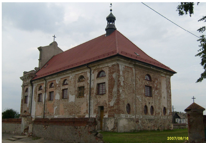
Zniszczona elewacja kościoła w Grabowie.