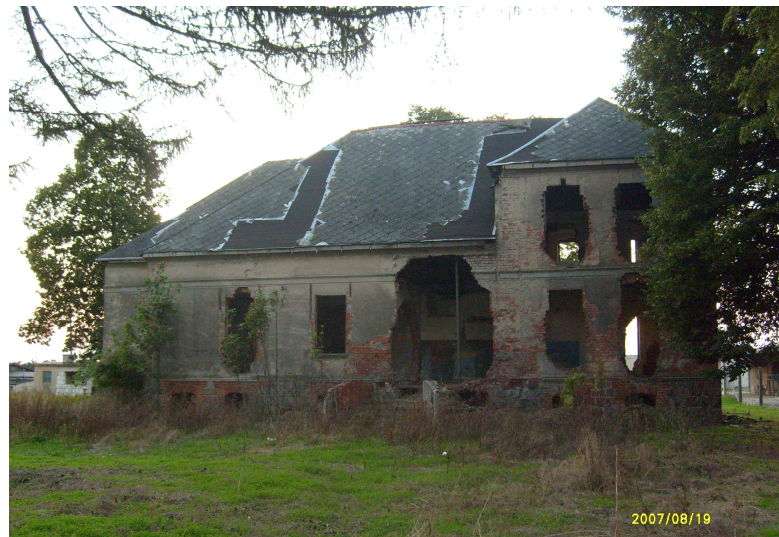
Ruiny pałacu w Grabowie Folwark (były PGR)

W okresie po II wojnie światowej wieś Grabowo należała do jednej z bardziej zamożnych wsi gminy Rożental a następnie Lubawy. Folwark zmieniono na PGR. W latach 90 XX w. W okresie transformacji gospodarstwo to, mające 246ha, podupadło, a zabudowania gospodarcze i pałac obróciły się prawie w ruinę (stan z 2004r.).