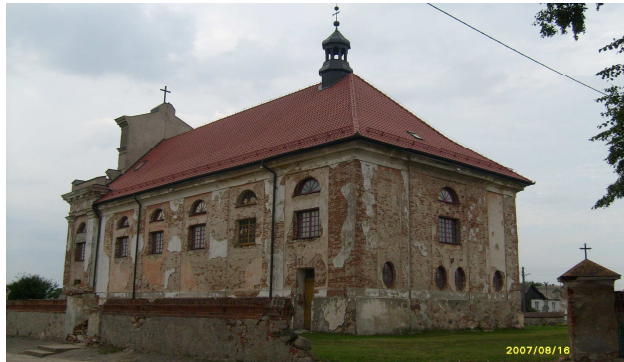
Kościół od strony południowo-zachodniej