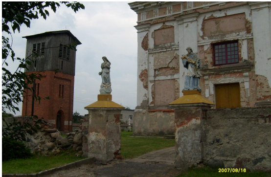
Kościół z XIV w.