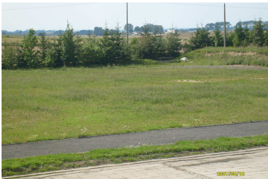
Fragment boiska szkolnego( obok miejsce na przebudowę chodnika)

Szkoła w Grabowie dysponuje w miarę dobrym zapleczem sportowym. Chociaż niewielka ale znajduje się tu sala gimnastyczna /12m x 24m/, siłownia, salka do gimnastyki korekcyjnej i kompleks boisk, który wymaga jednak modernizacji i rozbudowy aby spełniał wymogi bezpieczeństwa. Boisko do piłki nożnej wymaga wymiany nawierzchni, a teren pod budowę kompleksu małych boisk to tylko plac i dwie bramki. Boiska w latach 90-tych, mieszkańcy wsi wykonali w czynie społecznym.