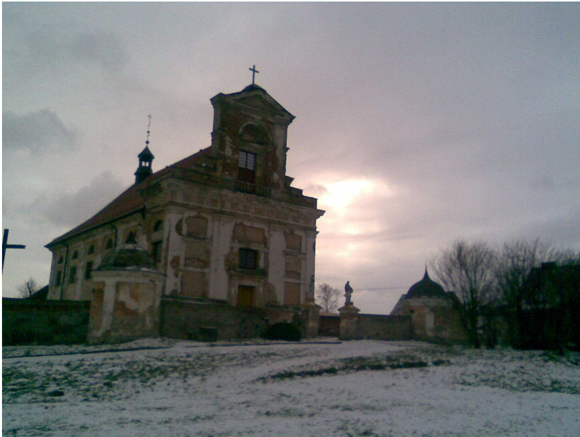
Klasycyistyczny kościół w Grabowie ( luty 2009 rok)

Wzniesiony w latach 1806-1814 wg projektu Hilarego Szpilowskiego. Postawiono go z cegły na podmurówce z kamieni polnych i otynkowano. Był kilkakrotnie restaurowany w 1888r. i 1938r. Do zabytków należą również pochodzące z początku XIX w. : ogrodzenie cmentarza przykościelnego, dzwonnica początku XX w., plebania, organistówka oraz kapliczka przydrożna.