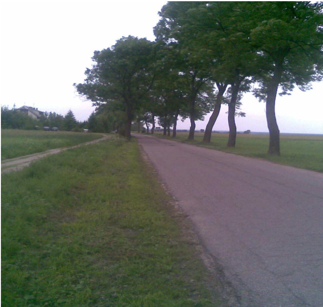
Fragment terenu „ziemi niczyjej” między tablicami Wałdyki i Grabowo, po lewej Zespół Szkół Wałdyki Grabowo.

osób w wieku geriatrycznym oraz niepełnosprawnych. Chodnik umożliwi dotarcie mieszkańców do jedyne centrum życia społeczno- kulturalnego, jakim jest Zespół Szkół Wałdyki- Grabowo. Inwestycję zaplanowano wzdłuż głównej drogi wiejskiej, obok sklepu, placu zabaw, remizy, w odległości ok. 50m.b. od firmy Constract Export- Import” sp.zo.o; tak aby połączyć wioski Grabowo i Wałdyki przy wspólnym Zespole Szkół. W ten sposób 180m.b chodnika znajdzie się w obrębie geodezyjnym Grabowa, ale między tablicami określającymi granice miejscowości.