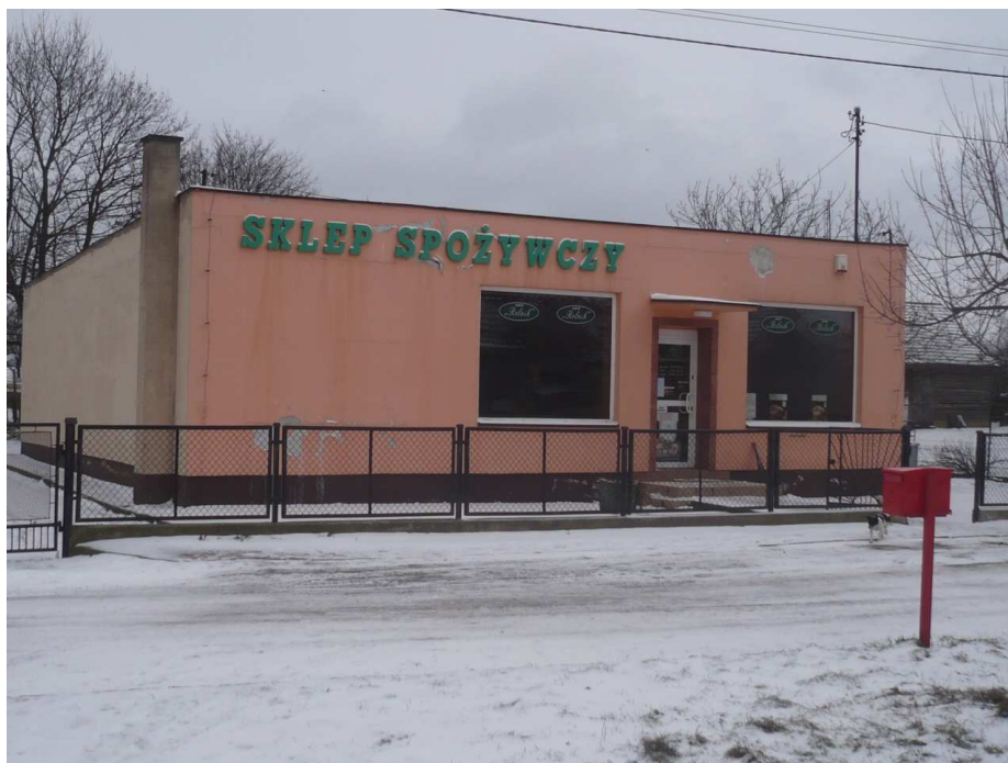
Nowoczesny sklep w centrum Wałdyk (obok planowanej przebudowy chodnika)