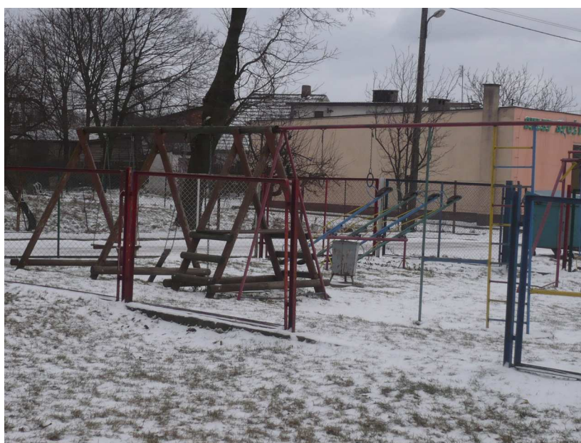
Plac zabaw w centrum Wałdyk (przy planowanej przebudowie chodnika)

Główna asfaltowa ulica biegnąca przez całą wieś jest 2km . Od niej odchodzą 2 krótkie uliczki boczne. Liniowy układ zabudowy jest bardzo ścisły, domy posadowione są na niewielkiej odległości od ulicy. Wieś cechuje zróżnicowana architektura i dość wysoka estetyka posesji. Widoczne są niedostatki zazielenienia.