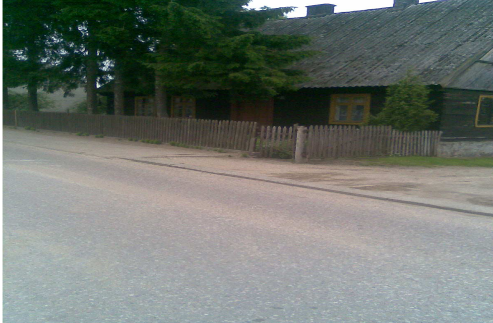
Chata-zabytek w Kazanicach(po prawej planowany III odcinek przebudowy chodnika)

Odcinek III po prawej przebiegający obok chat wpisanych do rejestru konserwatora zabytków, łączący się z chodnikami do szkoły, świetlicy i zakładu pracy.