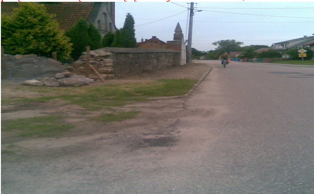
Widok drogi (planowana przebudowa II odcinka chodnika po lewej)

II obok kościoła, sklepów, zabytkowej szkoły po lewej pozwalający na połączenie z ulicą dochodzącą z lewej do centrum wsi,