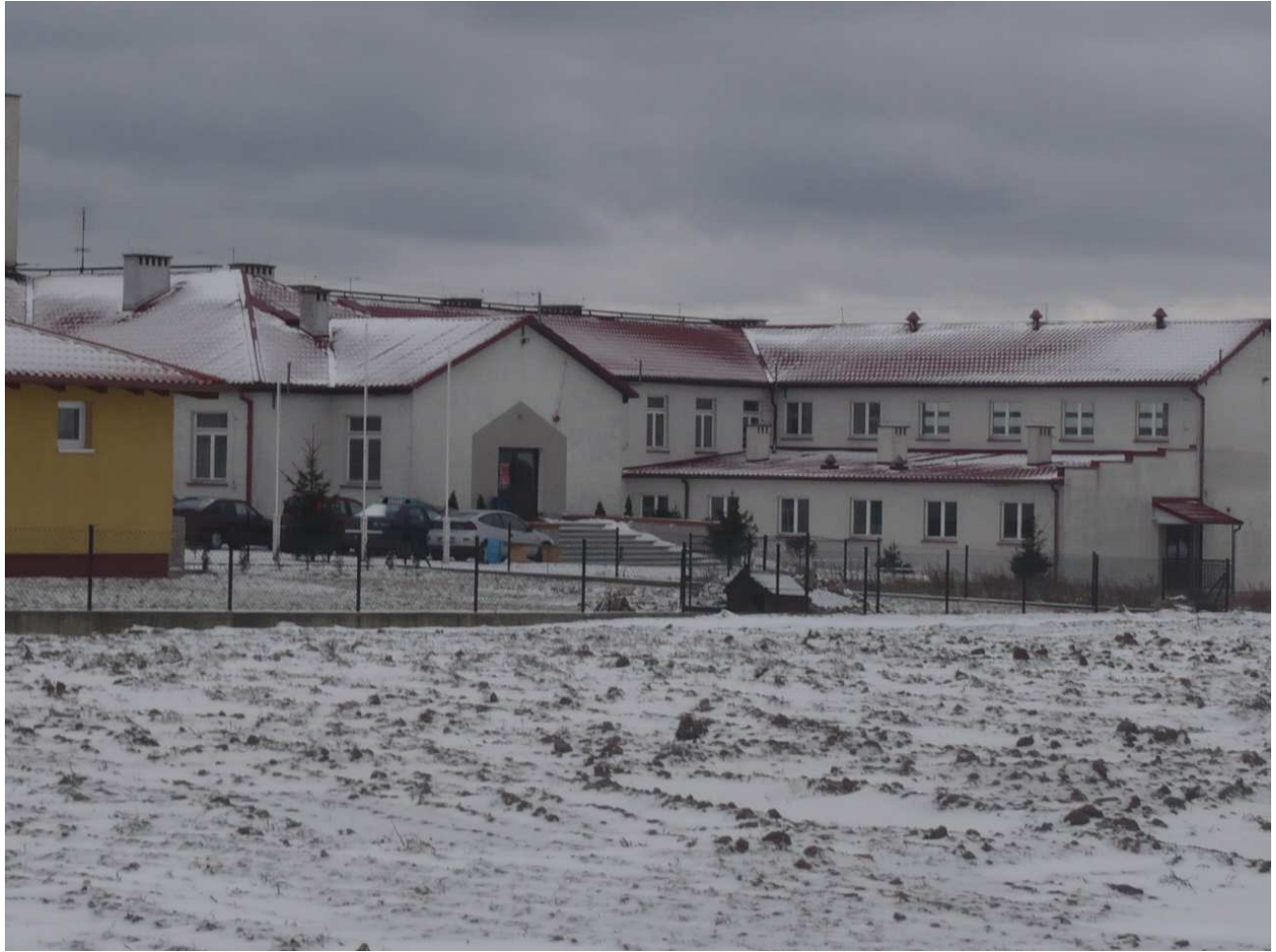
Szkoła w Kazanicach

Szkoła w Kazanicach dysponuje w miarę dobrym zapleczem sportowym. Chociaż niewielka ale znajduje się tu sala gimnastyczna /12m x 24m/, siłownia, salka do gimnastyki korekcyjnej i kompleks boisk, który wymaga jednak modernizacji i rozbudowy aby spełniał wymogi bezpieczeństwa. Boisko do piłki nożnej wymaga wymiany nawierzchni, a teren pod budowę kompleksu małych boisk to tylko plac i dwie bramki.