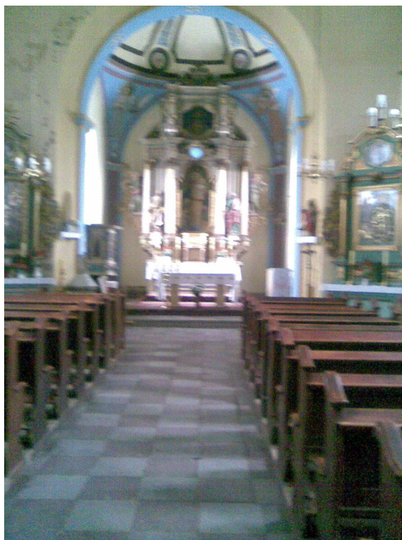
Wnętrze XIV wiecznego gotyckiego kościoła w Kazanicach

Dzieci już zaczęły pracę nad poznawaniem historii swojej wsi poszukując zabytków, zbierając informacje na ich temat i fotografując je.