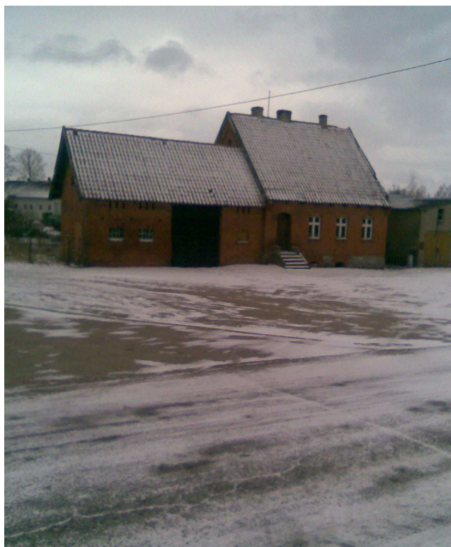
Stara szkoła w Kazanicach- wpisana do rejestru konserwatora zabytków (leży przy planowanej przebudowie chodnika)

W Kazanicach znajduje się wiele zabytków, które świadczą o bogatej historii wsi. Mieszkańcy, a szczególnie młodzież, nie wiele jednak wiedzą o przeszłości miejscowości, w której mieszkają.