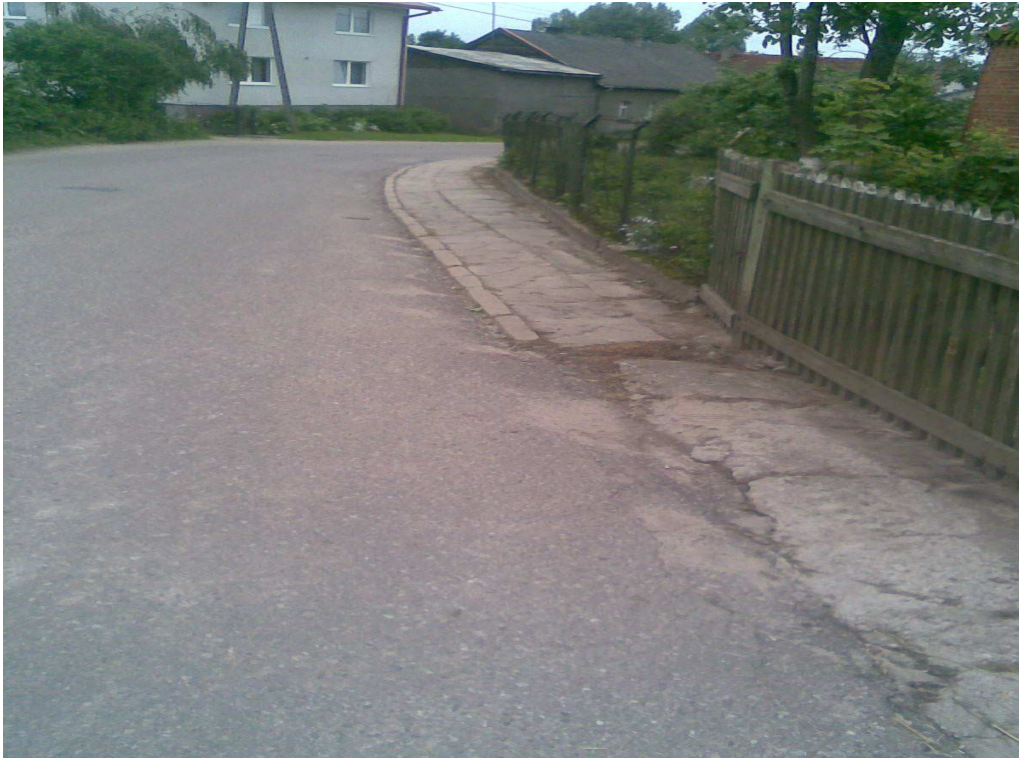
Główna droga Kazanic planowany I odcinek przebudowy chodnika(po prawej)

odcinkach głównej ulicy Kazanic: I od północy wsi do centrum biegnący po stronie prawej,