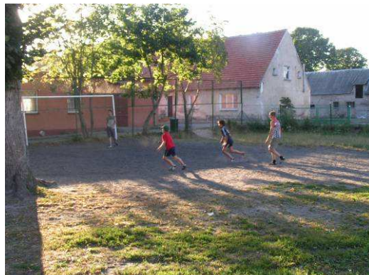
Młodzież grająca na boisku

W czasie wakacji młodzież i dzieci najczęściej pracują w gospodarstwach rolnych swoich rodziców. Mogą także bawić się na placu, które służy jako boisko. Nie ma tu jeziora, a rzeka jest, ale bardzo zanieczyszczona i nie można się w niej kąpać. Na terenie wsi nie ma domu kultury. Nie ma także szkoły, która może dzieciom organizować wypoczynek letni i zimowy. Rodziców nie stać na to, by wysłać swoje pociechy na kolonie, czy obozy letnie. Dlatego jeżeli już wyjeżdżają, to do mieszkającej w okolicy rodziny.