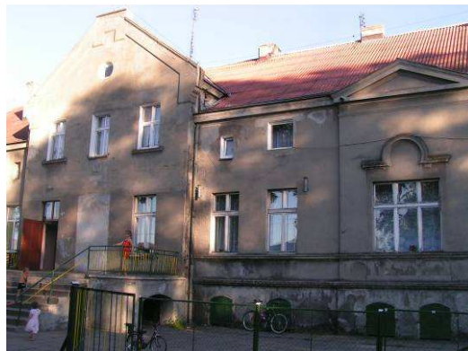
Dawny pałac i szkoła. Obecnie mieszkania komunalne.

W lipcu i sierpniu 2006 r. Rada Sołecka zrealizowała projekt pn. „Wakacje z historią i przyrodą Ziemi Lubawskiej”. Były to zajęcia warsztatowe oraz wycieczki krajoznawcze dla ok. 60 dzieci i młodzieży z sołectwa. Dzięki temu przedsięwzięciu: