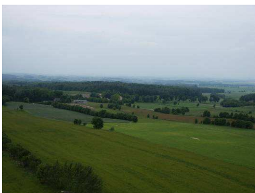
Widok ze Wzgórz Dylewskich 3

Rzeka Elszka jest bardzo zanieczyszczona – posiada wody pozaklasowe. Jest to efekt dzikich wysypisk śmieci w jej pobliżu, nielegalnego zrzutu ścieków oraz przesiąkania do gleby nieczystości komunalnych oraz gospodarczych. Od kilku lat stan wody nieco się poprawia, jednak sytuacja wciąż jest zła. W rzece nie można się kąpać.