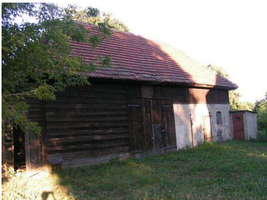
Stara stodoła – w przyszłości „muzeum” i pracownię rękodzieła

Ponadto społeczność wiejska powróciła do starego zwyczaju sadzenia drzewek na wiosnę. Tradycja ta wygasła ok. 25 lat temu. W kwietniu 2006 r. została wznowiona, a mieszkańcy zamierzają ją kontynuować.