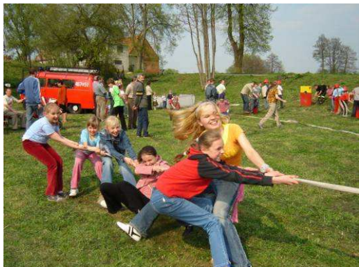
Młodzież na Pikniku Strażackim

dziewczęta z Targowiska zajmują pierwsze miejsca.