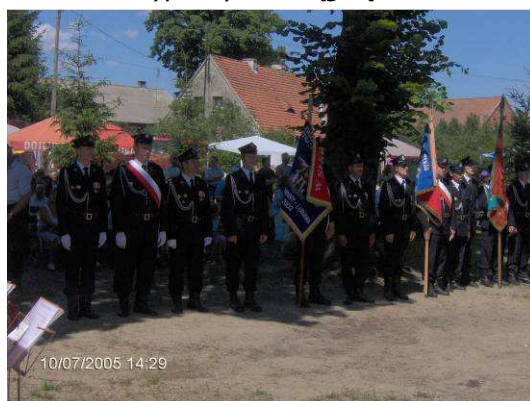
Obchody 90-lecia OSP

Co roku z inicjatywy OSP odbywa się Tydzień Strażacki . W tym czasie drużyny przygotowują się do zawodów gminnych i powiatowych. Na tym polu jednostka ma duże osiągnięcia – przez 10 lat czterokrotnie zajmowała I miejsce i jeden raz II