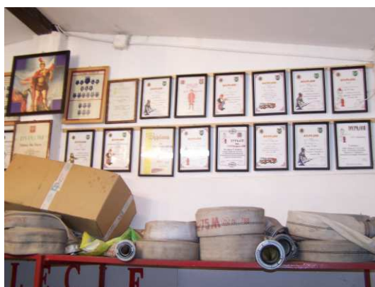
Dyplomy za osiągnięcia