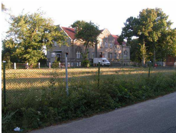
Budynek dawnej szkoły. Dziś są tu mieszkania komunalne.

Do roku 2004 w Targowisku Dolnym była szkoła podstawowa. Została ona zlikwidowana, a budynek zagospodarowano na mieszkania komunalne. Od tego czasu dzieci uczą się w Zespole Szkół w Sampławie oddalonym o 3 km. Jest tu klasa zerowa, szkoła podstawowa oraz gimnazjum. Uczniowie są dowożeni na zajęcia autobusem szkolnym.