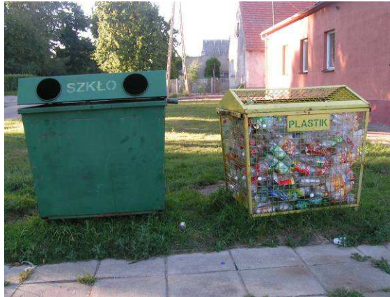
Jedno z trzech stanowisk do selektywnej zbiórki odpadów

W Targowisku stosuje się selektywną zbiórkę odpadów. Na terenie wsi stoją pojemniki na szkło i plastik. Są trzy stanowiska, ale zdaniem mieszkańców powinny być jeszcze dwa.