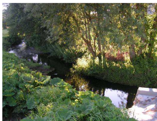
Rzeka Elszka w Targowisku Dolnym

Na wschód od Targowiska, przy granicach Gminy Lubawa na Garbie Lubawskim znajduje się Park Krajobrazowy Wzgórz Dylewskich. Jest to obszar najwyższej rangi w sieci ekologicznej ECONET-POLSKA – jako biocentrum zachodnio-mazurskiego obszaru węzłowego o znaczeniu międzynarodowym. Osobliwa rzeźba tego terenu wyróżnia się w skali całej północnej części Polski. Znajduje się tu najwyższe na całym Pojezierzu Mazurskim wzniesienie – Góra Dylewska (312 m.n.p.m.). 24 gatunki flory występującej w parku objęte są ścisłą ochroną.