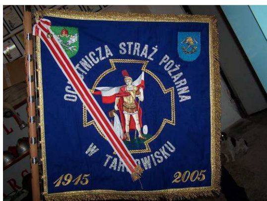
Sztandar OSP z okazji 90-lecia

W Targowisku działa Ochotnicza Straż Pożarna (OSP) o bardzo bogatej tradycji. W roku 2005 OSP świętowała 90-ciolecie istnienia. Już od lat przedwojennych OSP stanowiła Targowisku centrum życia wiejskiego Organizowała zajęcia i zawody dla dzieci, młodzieży i dorosłych, bale, festyny itp. Obecnie jednostka zrzesza 23 członków czynnych, 10 członków młodzieżowej drużyny żeńskiej i 10 drużyny męskiej w wieku do 16 lat.