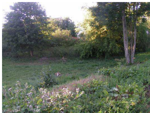
Teren nad rzeką Elszka pod przyszły amfiteatr

Pod względem historycznym, geograficznym i przyrodniczym obszar, na którym położona jest wieś nazywany jest Ziemią Lubawską.