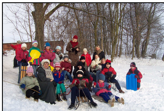
Zajęcia informatyczne i sportowe w świetlicy socjoterapeutycznej.