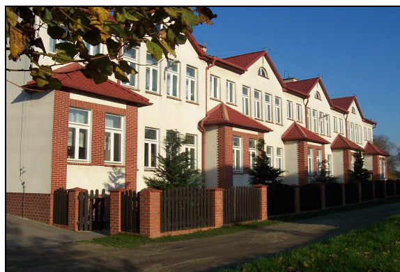
Nowy budynek szkoły.