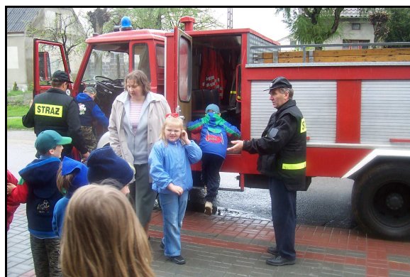
Wizyta przedszkolaków u strażaków.