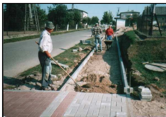
Budowa nowego chodnika.