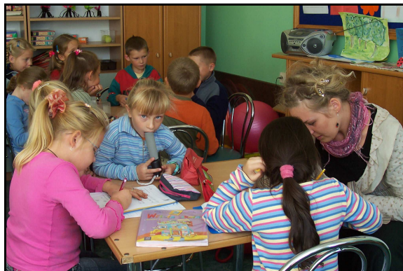
Zajęcia w świetlicy socjoterapeutycznej.