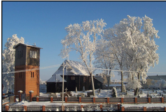
Zabytkowy kościół z 1725 r.