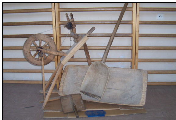
Pierwsze eksponaty do przyszłego muzeum.

W szkole podstawowej, przy współdziałaniu rodziców oraz uczniów, zbierane są ekspozyty do tworzonej Izby Tradycji Regionalnej. W okresie wakacji, dla dzieci, młodzieży i osób dorosłych w szkole organizowane są plenery malarskie. W warsztatach plastycznych doskonali swój warsztat młodzi artyści oraz osoby dorosłe. Inni mieszkańcy mogą kontaktować się ze sztuką poprzez wystawy.