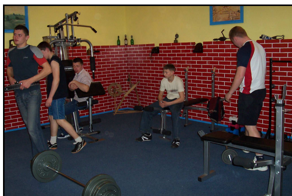
Zajęcia młodzieży w siłowni.

Część młodzieży regularnie uczestniczy na zajęciach w siłowni szkolnej. Aktywnie również młodzi mieszkańcy uczestniczą w rozgrywkach tenisa stołowego. Od wielu lat tenisiści ze Złotowa należą do najlepszych w gminie, powiecie i województwie.