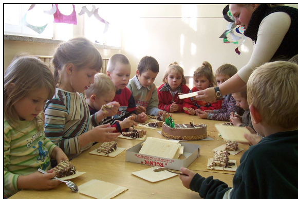
Przedszkolaki podczas zajęć.