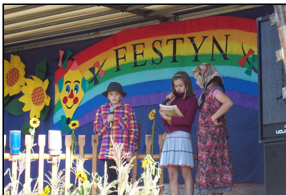
Rodzinny Festyn Dożynkowy.