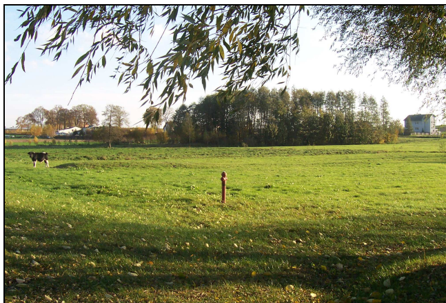
Teren pod przyszłe boisko.

Część młodzieży regularnie uczestniczy na zajęciach w siłowni szkolnej. Aktywnie również młodzi mieszkańcy uczestniczą w rozgrywkach tenisa stołowego. Od wielu lat tenisiści ze Złotowa należą do najlepszych w gminie, powiecie i województwie.