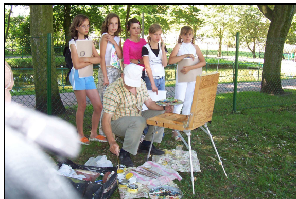
Młodzi artyści podczas pleneru malarskiego.