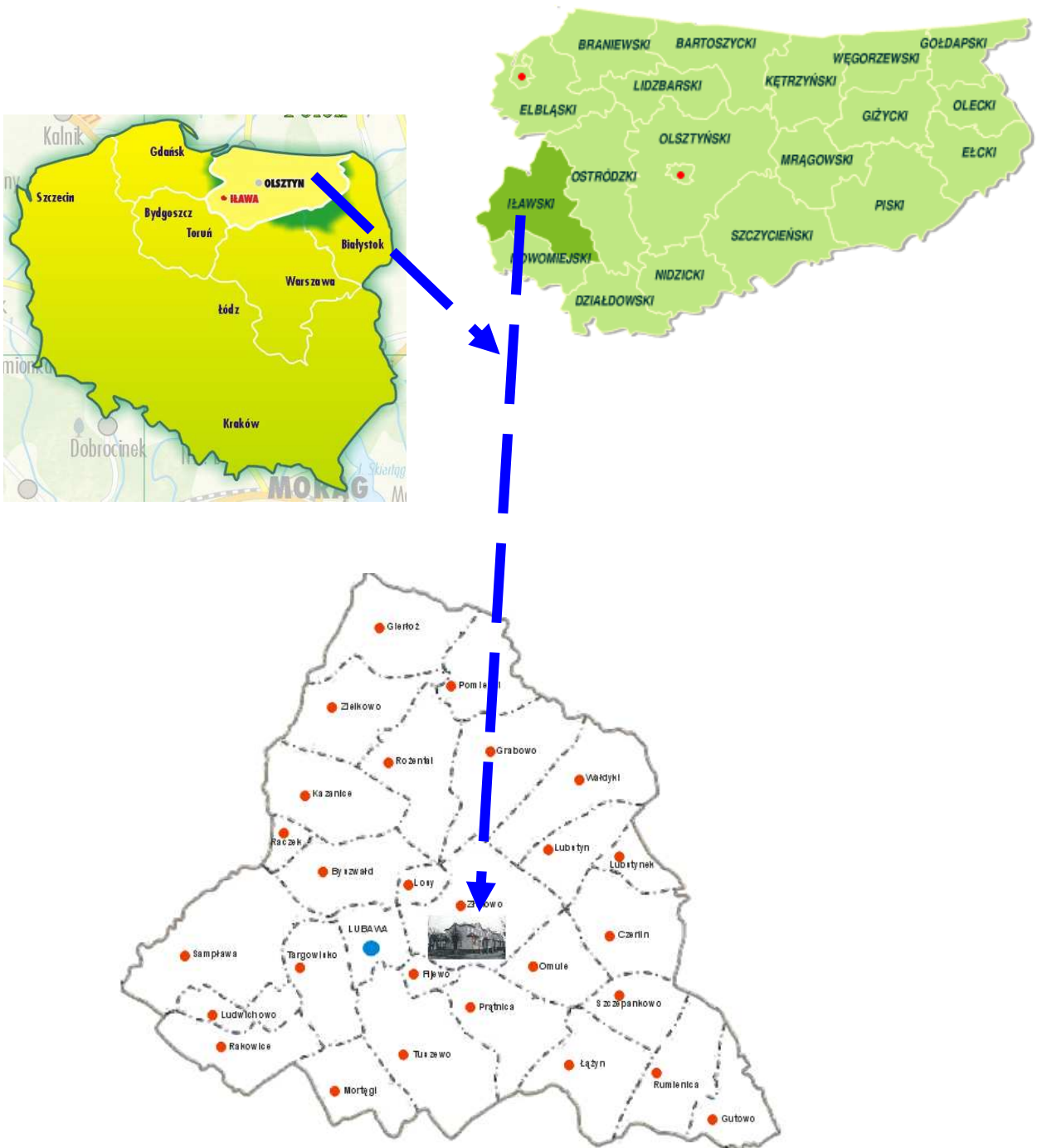
Położenie Złotowa na mapie Gminy Lubawa