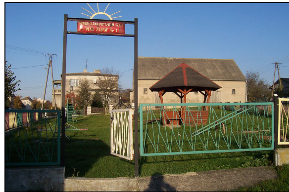
Plac zabaw dla dzieci.