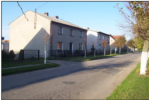
Nowe domy w Złotowie.

Złotowo w trakcie swej drogi przez zmienne dzieje stało się miejscowością o własnych, silnych tradycjach religijnych, kulturowych, patriotycznych, gospodarczych, sportowych, umiejącą działać wspólnie dla dobra lokalnej społeczności. Duży wpływ na to miała długotrwała historyczna przynależność do dóbr biskupich stwarzających ku temu odpowiednie warunki, jak i silne osobowości życia złotowskiego.