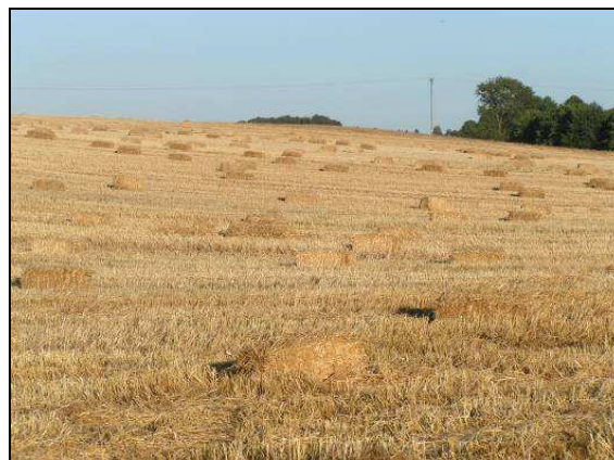
Żniwa w Złotowie.

Rolnicy w pełni wykorzystują nowe możliwości jakie stwarza członkostwo Polski w Unii Europejskiej i otrzymuje dopłaty bezpośrednie do produkcji rolnej.