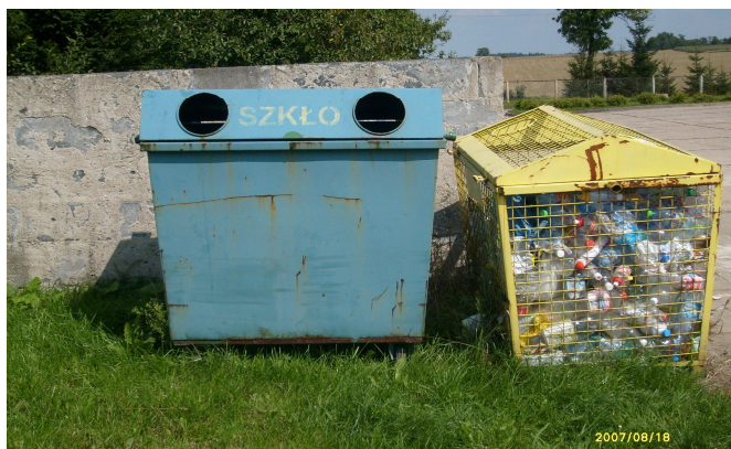
Jedno z trzech stanowisk do selektywnej zbiórki odpadów

W Grabowie stosuje się selektywną zbiórkę odpadów. Na terenie wsi stoją pojemniki na szkło i plastik. Są trzy stanowiska, ale zdaniem mieszkańców powinny być jeszcze dwa.