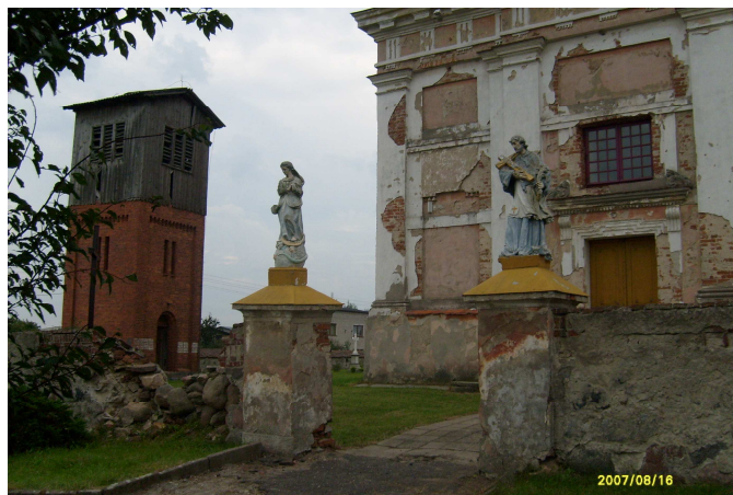
Zniszczony front kościoła.

W 2001r. 2 listopada, miał miejsce pożar kościoła. Spłonął dach i sufit. Wewnątrz świątyni spaliły się organy, uszkodzeniu uległ obraz w górnej części ołtarza. Pozostałe wyposażenie udało się uratować. Po pożarze kościół jest w trakcie odbudowy. Ciągłe jednak brakuje środków na jego odbudowę. Nie zaczęta jest elewacja zewnętrzna i odbudowa ogrodzenia. Mieszkańcy sami zbierają środki na remont ale jest to „kropla w morzu” w stosunku do kosztów.