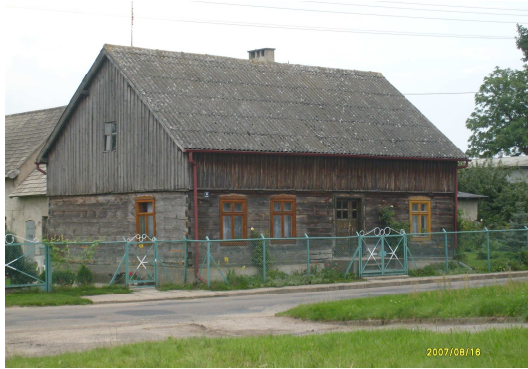
Drewniany dom z połowy XIX w.