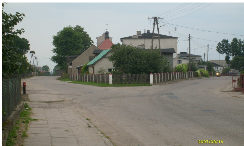
Rozwidlenie ulic w Grabowie

Jedną z tych przecznic jest 2km droga asfaltowa prowadząca na południe do „osiedla” po byłym folwarku a następnie PGR-ach.