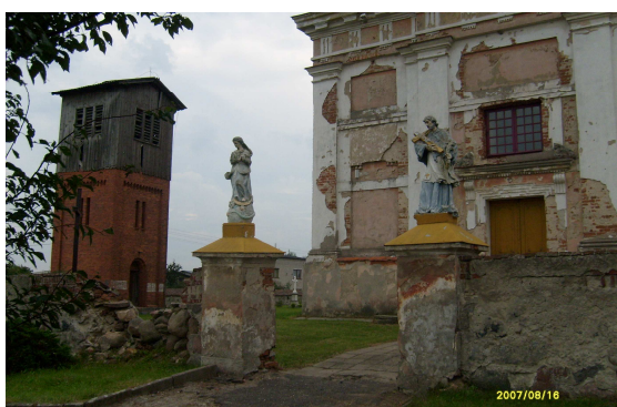
Kościół z XIV w.