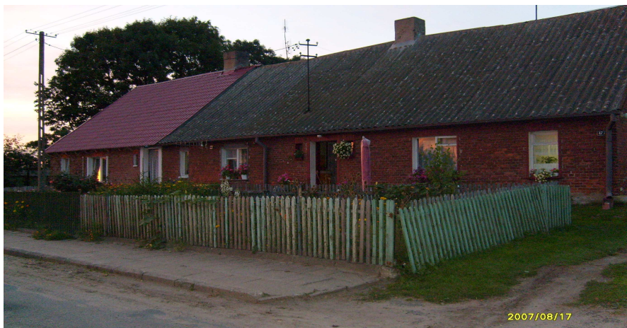
W tym budynku mieściła się kiedyś poczta.