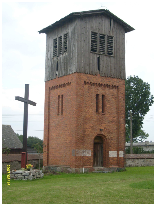
Dzwonnica przy kościele w Grabowie