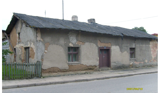
Zabytkowy dom z gliny