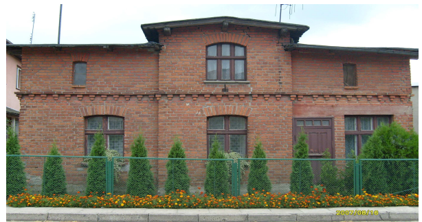
Zabytkowy dom (były sklep wędliniarski)