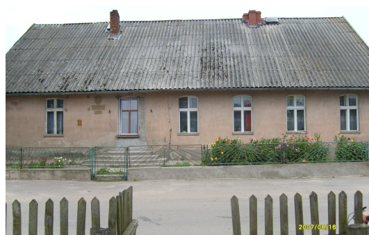
Stara szkoła w Grabowie

Za wsią, w odległości około 1,5km usytuowana jest szkoła - Zespół Szkół Grabowo – Władyki, którą oddano do użytku 1990r