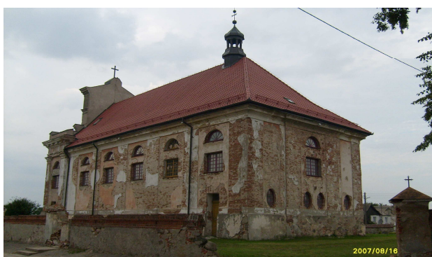
Kościół od strony południowo-zachodniej