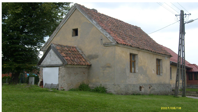
Stara „wikariatka” później „organistówka”

W Grabowie znajduje się wiele zabytków, które świadczą o bogatej historii wsi. Mieszkańcy, a szczególnie młodzież, nie wiele jednak wiedzą o przeszłości miejscowości, w której mieszkają. Dlatego Rada Sołecka razem z młodzieżą pragną utworzyć „izbę tradycji” w starej nieużywanej organistówce.