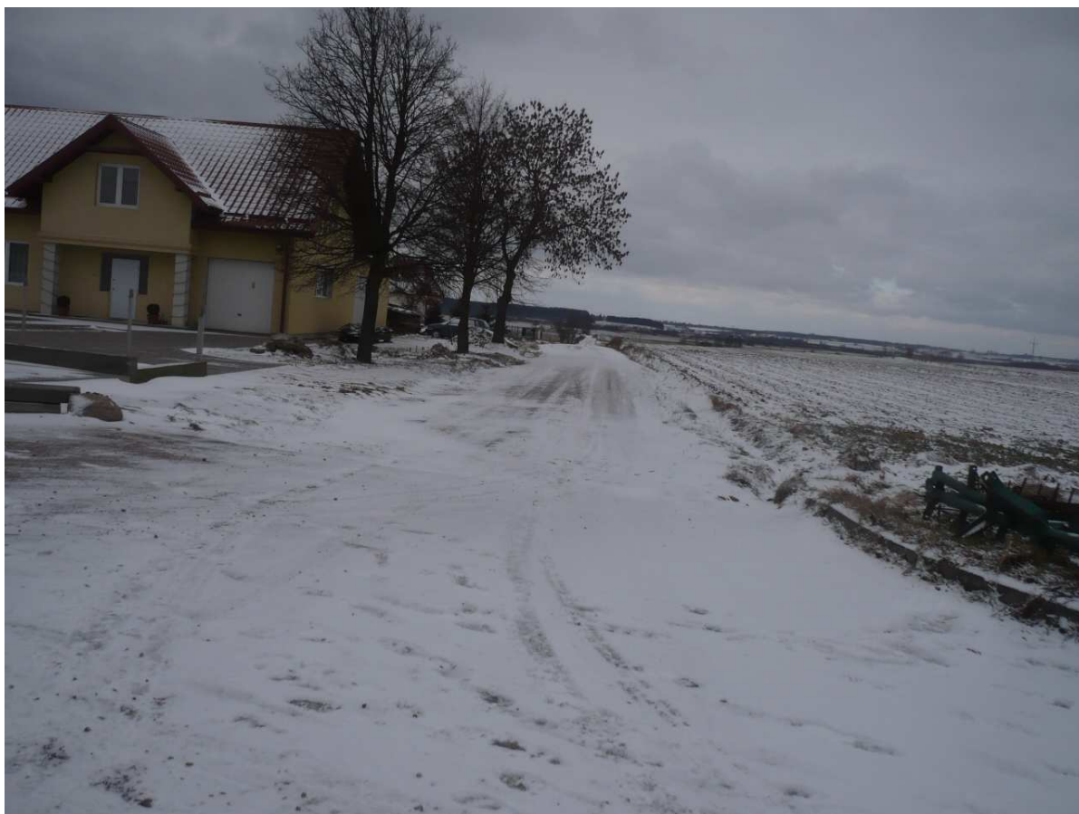
Osiedle po lewej, droga przy której będzie budowany chodnik

Większość posesji jest zadbana i utrzymana w czystości. We wsi znajdują się chodniki lecz ich stan jest bardzo zły i wymaga remontu. W miarę rozwoju wsi konieczne jest wybudowanie nowych chodników. Mieszkańcy wsi stopniowo odnawiają elewację domów i wymieniają poszycia dachowe.