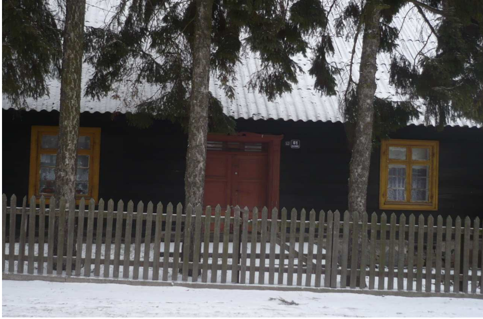
Jedna z 6 chat –zabytków Kazanic (Nr 61)