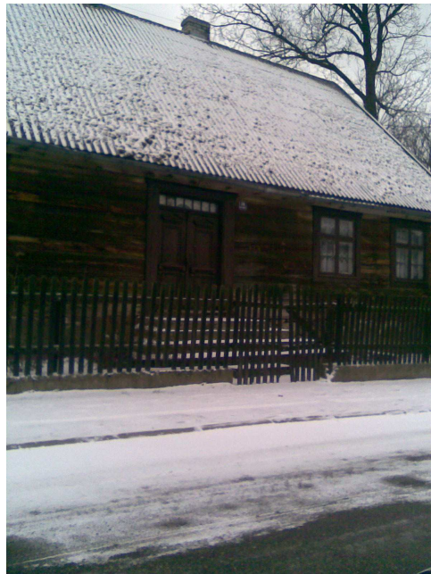
Chata-zabytek w Kazanicach