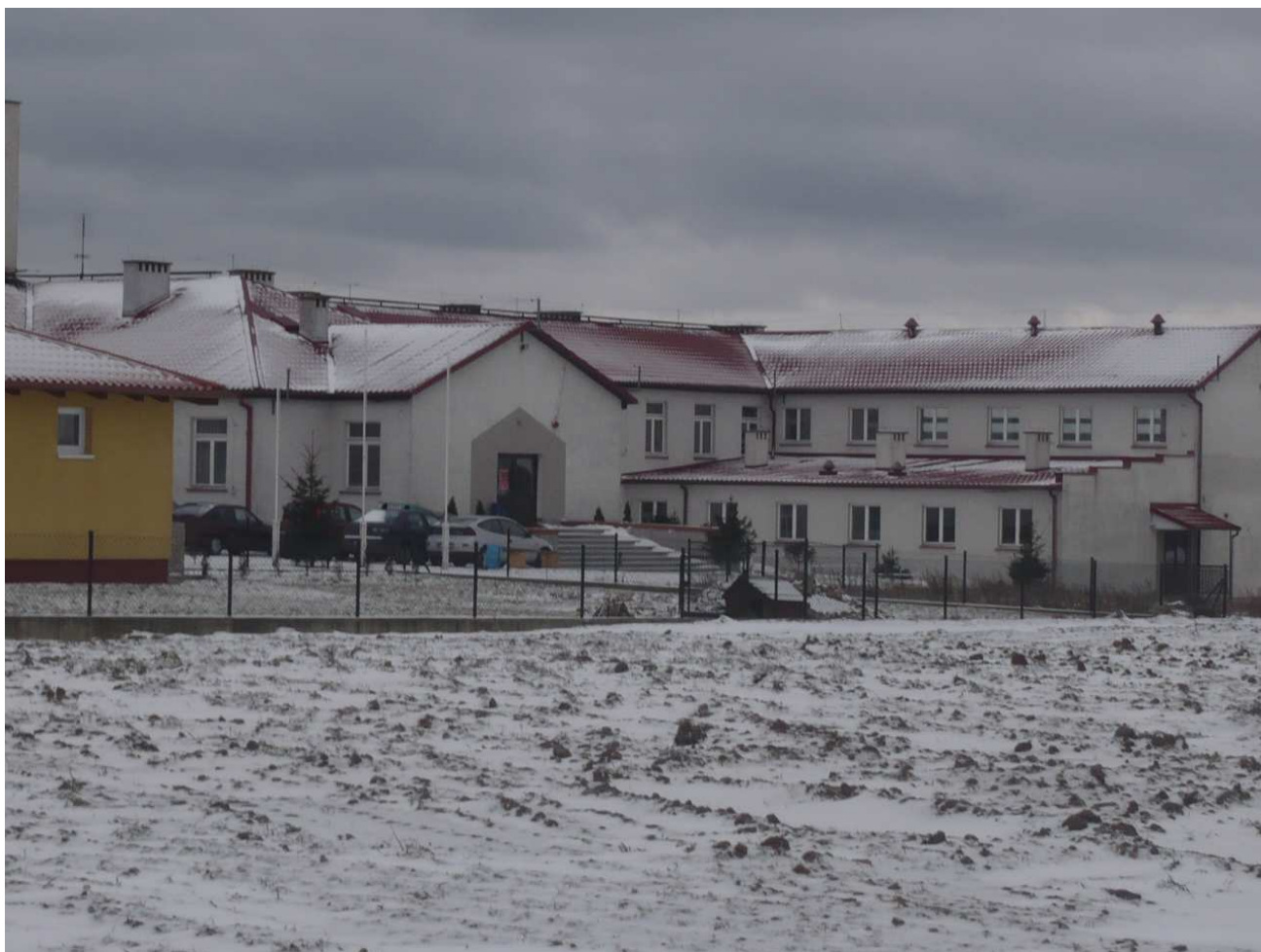
Szkoła w Kazanicach

Szkoła w Kazanicach dysponuje w miarę dobrym zapleczem sportowym. Chociaż niewielka ale znajduje się tu sala gimnastyczna /12m x 24m/, siłownia, salka do gimnastyki korekcyjnej i kompleks boisk, który wymaga jednak modernizacji i rozbudowy aby spełniał wymogi bezpieczeństwa. Boisko do piłki nożnej wymaga wymiany nawierzchni, a teren pod budowę kompleksu małych boisk to tylko plac i dwie bramki.