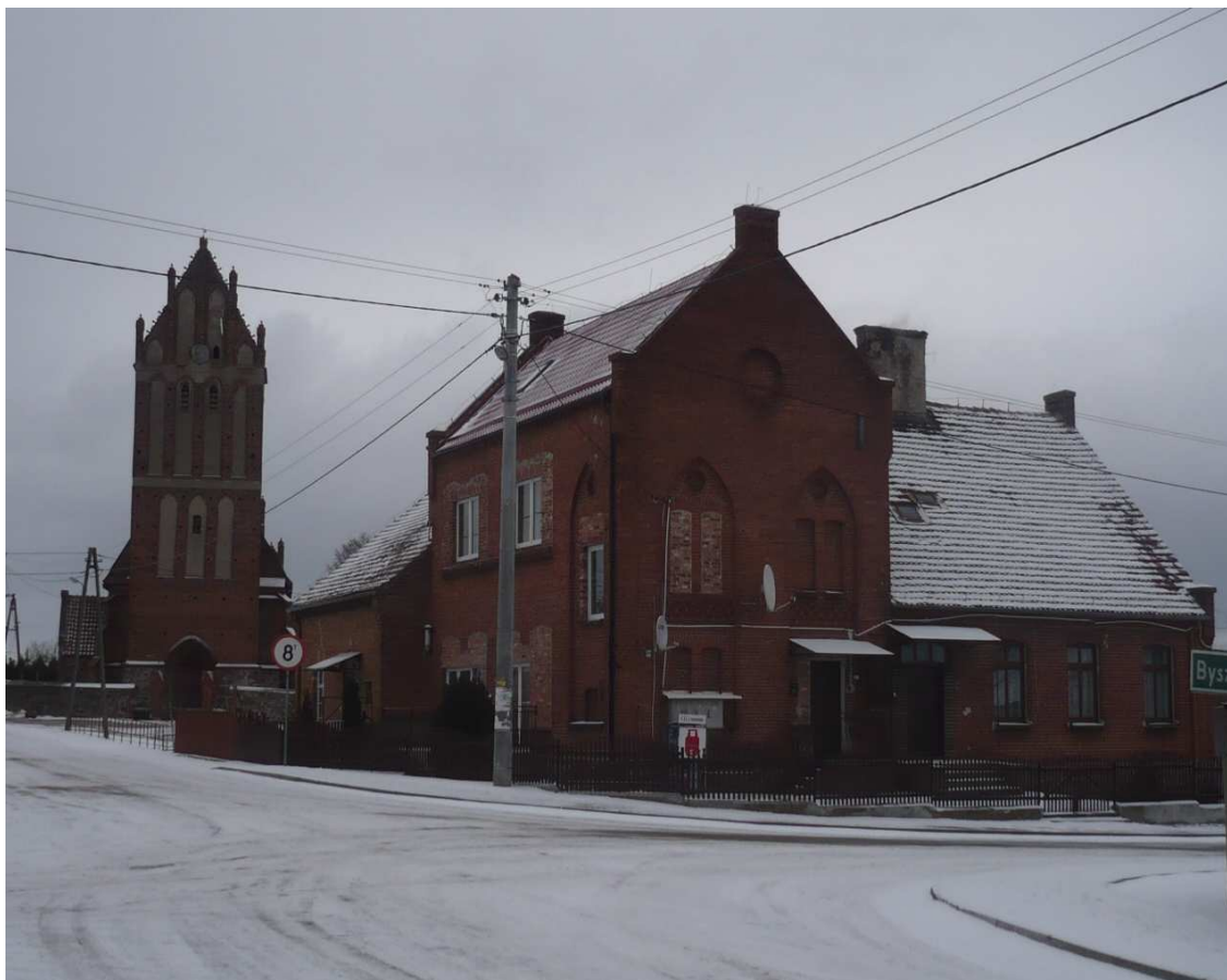
Centrum Kazanice z widokiem na XIV wieczny kościół