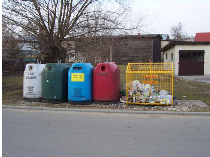
Selektywna zbiórka odpadów

W Rożentalu stosuje się selektywną zbiórkę odpadów. Na terenie wsi stoją pojemniki na szkło i plastik.