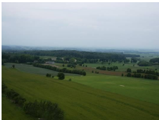
Widok ze Wzgórz Dylewskich 9

Rzeka Elszka jest bardzo zanieczyszczona – posiada wody pozaklasowe. Jest to efekt dzikich wysypisk śmieci w jej pobliżu, nielegalnego zrzutu ścieków oraz przesiąkania do gleby nieczystości komunalnych oraz gospodarczych. Od kilku lat stan wody nieco się poprawia, jednak sytuacja wciąż jest zła. W rzece nie można się kąpać.