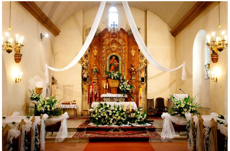
Ołtarz główny w kościele

Powiększył powierzchnię kościoła poprzez dobudowę dwóch bocznych kaplic. Był również założycielem nowego cmentarza parafialnego za wsią. Postawił też figurę obok