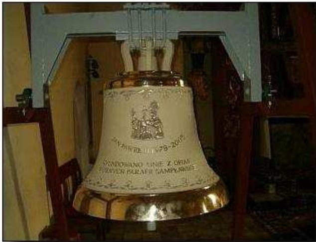
Dzwon „Jan Paweł II”

organy, wymienił pokrycie dachowe, pobudował taras, na którym obecnie odbywają się odpusty w parafii oraz przeprowadził remont ogrodzenia. Uwieńczeniem zasług księdza było wykonanie dzwonu oraz jego instalacja na wieży kościelnej.