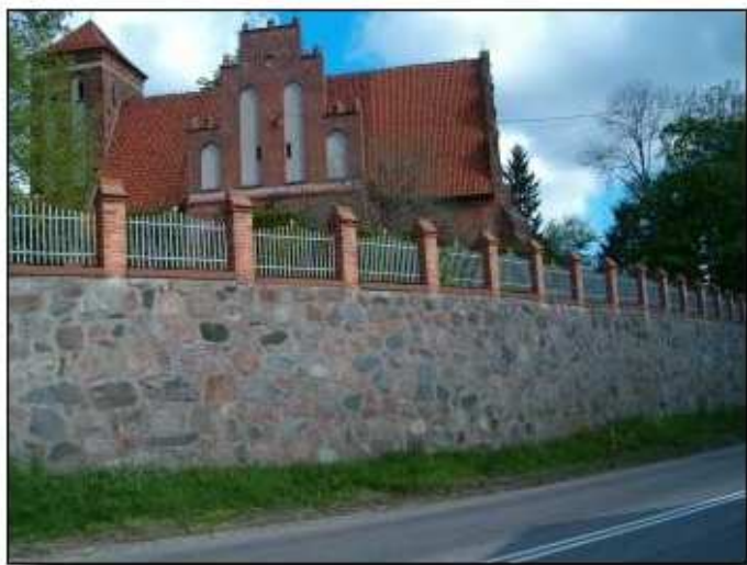
Kościół – widok z drogi krajowej kierunek Nowe Miasto Lub. – Lubawa

Do parafii należą: wieś Biała Góra (4 km), Ludwichowo (3 km), Łązek (3,5 km), Osowiec (7 km), Rakowice (7 km), Rodzone (2,5 km), Samplawa Wybudowania (1,5 km), Targowisko Dolne (4 km), Rodzone za Drwęcą (3 km), Mały Bór (5 km), Papiernia (5 km). Parafia liczy obecnie około 1550 wiernych.