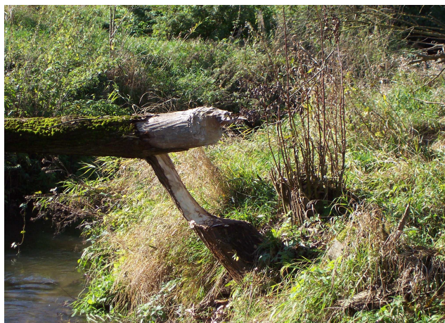
Drzewo powalone przez bobra

W części zachodniej gminy (tj. okolice Borku, Samplawy, Białej Góry – w rejonie prawie równinnej Doliny Drwęcy, występują najniższe partie terenu (85 – 120 m n.p.m.). Jej obrzeża stanowią piaski wodnolodowcowe, a części centralne zajmują młodsze osady rzeczne i holocenijskie torfy. Skłon wysoczyzny do doliny lokalnie jest stromy i rozczłonkowany.