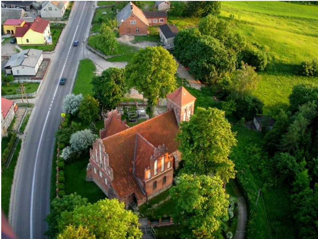
Kościół św. Bartłomieja i Mikołaja