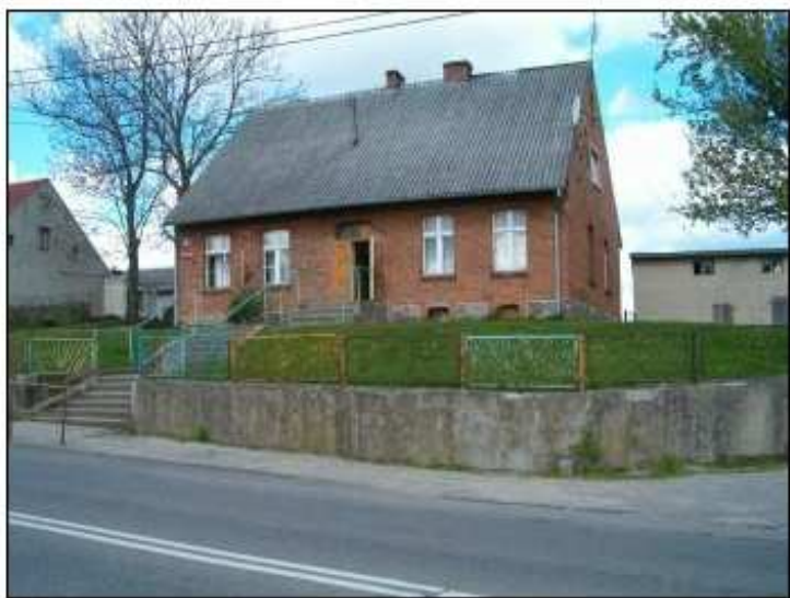
Budynek dawnej szkoły

Jednym z niewielu obiektów i instytucji znajdujących się we wsi jest szkoła, która spełnia wiele istotnych funkcji w życiu mieszkańców. Jest zarówno ośrodkiem kultury oraz sportu i rekreacji.