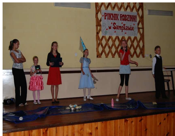
Piknik rodzinny w Samplawie