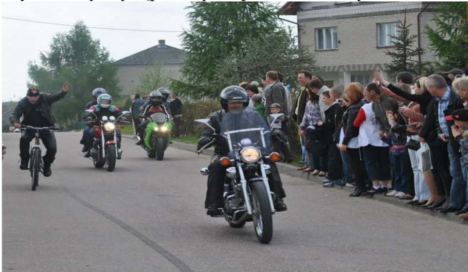
Fragment kordonu motocykli – Dni Kazanic maj 2010 r.

Szkoła w Kazanicach jest miejscem integracji mieszkańców, na jej terenie odbywają się dożynki gminne, festyny, imprezy sportowe, choinki noworoczne, inne imprezy okolicznościowe oraz corocznie przy współudziale mieszkańców wsi organizowane są Dni Kazanic, które cieszą się różnymi atrakcjami. Punkt centralny imprezy znajduje się na terenie szkoły oraz na pobliskim boisku do piłki nożnej, gdzie gromadzą się mieszkańcy wsi i okolic, integrując się podczas rozgrywanych meczy, występów czy też pokazów motocykli.