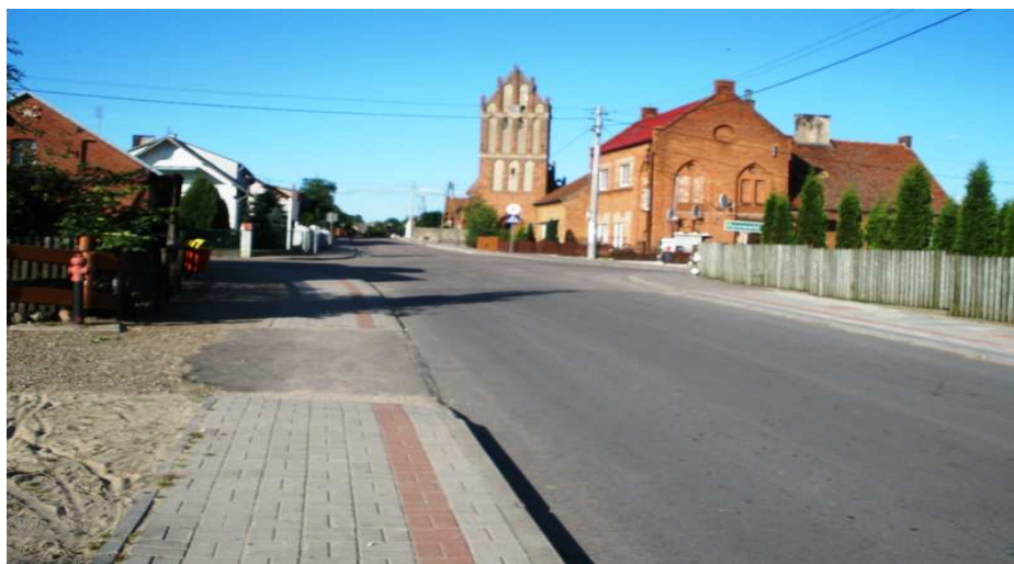
Część centrum wsi Kazanice z widokiem na kościół parafialny pw. Św. Jakuba Ap.

Jednym z obszarów jest centrum wsi zlokalizowane w starej części Kazanic w wzdłuż dróg: powiatowej nr P1231N oraz gminnej G147003N będących głównym ciągiem komunikacji w miejscowości.