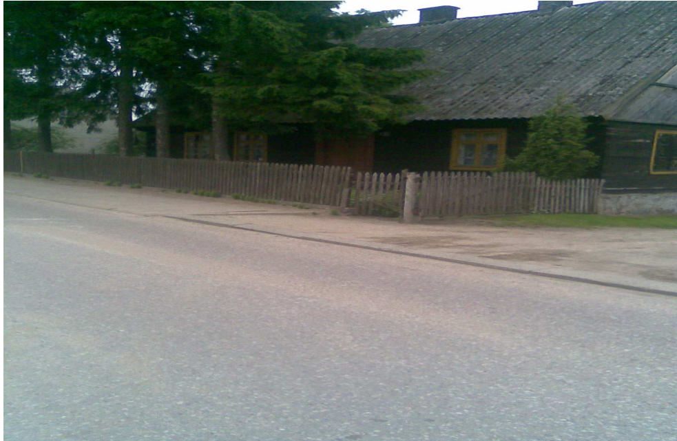
Chata-zabytek w Kazanicach

Poważne ożywienie społeczno-gospodarcze Kazanic nastąpiło w latach siedemdziesiątych. Wsią sołecką Kazanice stały się w 1973 roku. W 1977 wybudowano tu mieszalnię pasz. W 1978 r. miejscowość liczyła 760 mieszkańców. W tym samym roku istniała tu filia Zbiorczej Szkoły Gminnej w Lubawie i punkt biblioteczny.