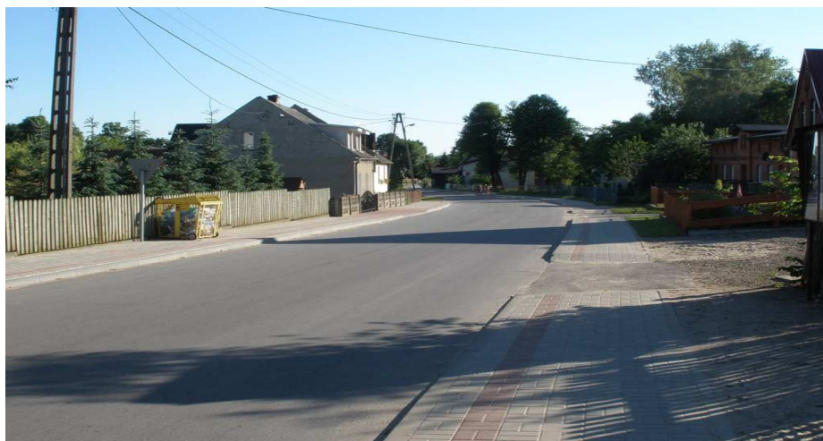
Nowe chodniki w miejscowości Kazanice

Mieszkańcy wsi stopniowo odnawiają elewację domów i wymieniają poszycia dachowe.