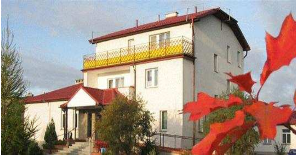
Zespół Szkół w Kazanicach

Szkoła w Kazanicach jest miejscem integracji mieszkańców, na jej terenie odbywają się dożynki gminne, festyny, imprezy sportowe, choinki noworoczne, inne imprezy okolicznościowe oraz corocznie przy współudziale mieszkańców wsi organizowane są Dni Kazanic, które cieszą się różnymi atrakcjami. Punkt centralny imprezy znajduje się na terenie szkoły oraz na pobliskim boisku do piłki nożnej, gdzie gromadzą się mieszkańcy wsi i okolic, integrując się podczas rozgrywanych meczy, występów czy też pokazów motocykli.