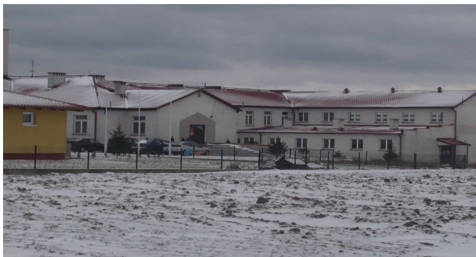
Szkoła w Kazanicach

Mieszkańcy wsi stopniowo odnawiają elewację domów i wymieniają poszycia dachowe.