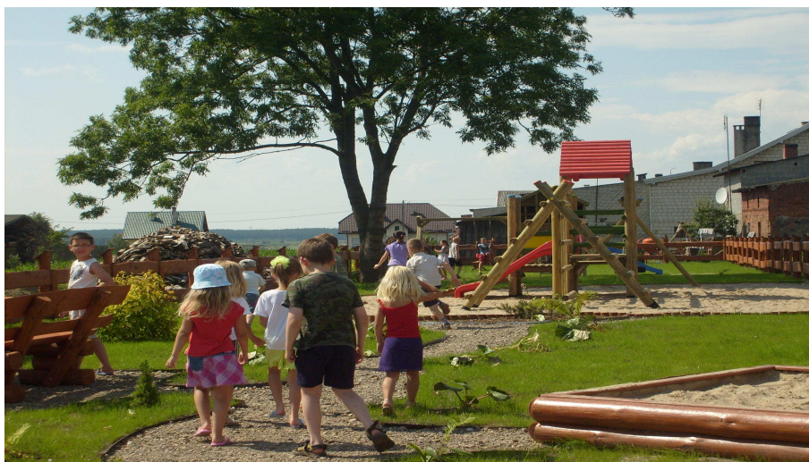
„Ogródek Jordanowski” w Kazanicach

Wyposażony jest w kolorowe koniki, zjeżdżalnie, huśtawki, domek, drabinki, piaskownicę, dla korzystających przewidziano również palenisko na ognisko oraz piękny drewniany zestaw do wypoczynku składający się ze stołu i wygodnych ławek. Obiekt ten ze względu na położenie i cechy funkcjonalno-przestrzenne stanowi atrakcyjne miejsce spędzania wolnego czasu, integracji i nawiązywania kontaktów społecznych, zwłaszcza wśród dzieci i młodzieży.