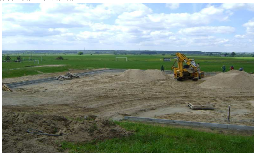
Boisko wielofunkcyjne w Kazanicach w trakcie budowy

We wsi dominuje zabudowa jednorodzinna i zagrodowa. Znajduje się tu 146 gospodarstw. Architektura Kazanic jest bardzo zróżnicowana i z dobrym skutkiem łączy stare z nowym. Zabytki ładnie komponują się z nowoczesnym osiedlem. W części wsi zbudowano już dobre ulice i chodniki. W kolejnych latach należy rozwiązać problem świetlicy wiejskiej, która wymaga kapitalnego remontu. Młodzież z Kazanic wyraziła potrzebę budowy bieżni przy szkole i wielofunkcyjnego boiska sportowego dla wsi. W chwili obecnej planowana inwestycja jest realizowana.