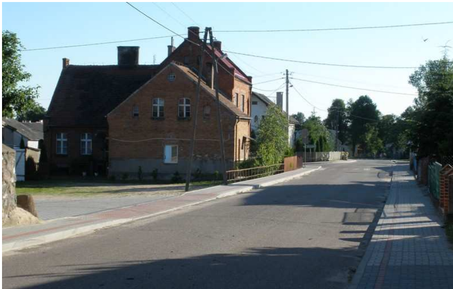
Stara szkoła w Kazanicach- wpisana do rejestru konserwatora zabytków

W Kazanicach znajduje się wiele zabytków, które świadczą o bogatej historii wsi. Mieszkańcy, a szczególnie młodzież, nie wiele jednak wiedzą o przeszłości miejscowości, w której mieszkają.