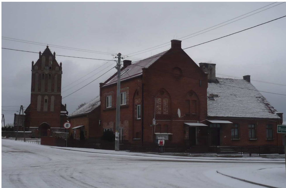
Centrum Kazanic z widokiem na XIV wieczny kościół

Poważne ożywienie społeczno-gospodarcze Kazanic nastąpiło w latach siedemdziesiątych. Wsią sołecką Kazanice stały się w 1973 roku. W 1977 wybudowano tu mieszalnię pasz. W 1978 r. miejscowość liczyła 760 mieszkańców. W tym samym roku istniała tu filia Zbiorczej Szkoły Gminnej w Lubawie i punkt biblioteczny.