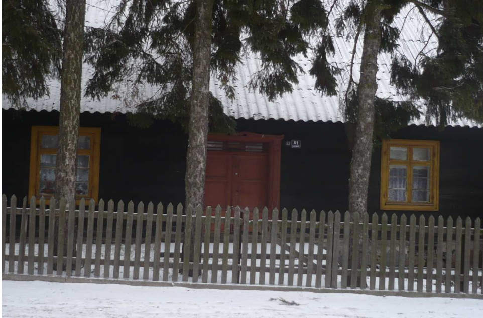
Jedna z 11 chat –zabytków Kazanice (Nr 61)