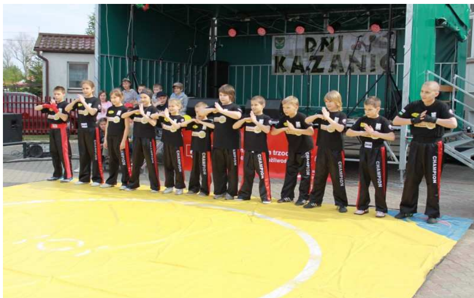
Dni Kazanic maj 2010 r.

Dużym atutem wsi jest działający tu LZS JORDAN Kazanice, który od dwóch sezonów występuje w A klasie wojewódzkiej. Bardzo prężnie działa też Ochotnicza Straż Pożarna. Młodzież gimnazjalna aktywnie włącza się w życie wsi, także w opracowanie Planu Odnowy Miejscowości Kazanice.