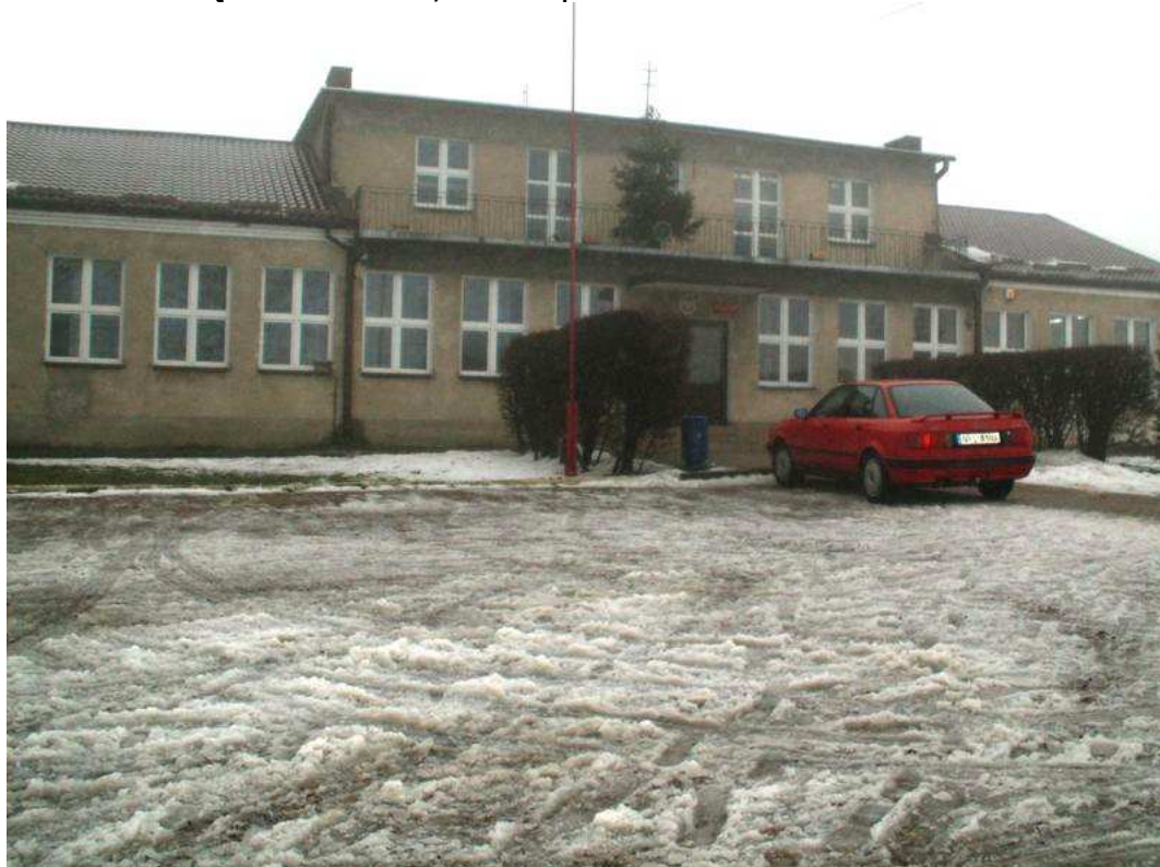
Szkoła Podstawowa w Byszwałdzie

zamknięto, a nauczycieli wywieziono do przymusowych prac w głąb Niemiec. W szkole mieści się klasa zerowa, szkoła podstawowa.