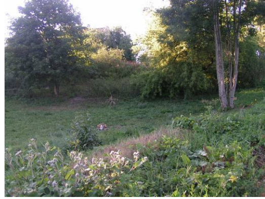
Teren nad rzeką Elszka pod przyszły amfiteatr