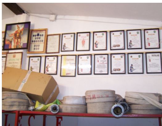
Dyplomy za osiągnięcia