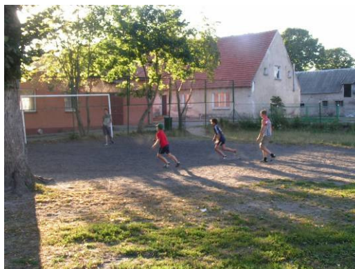
Młodzież grająca na boisku

W czasie wakacji młodzież i dzieci najczęściej pracują w gospodarstwach rolnych swoich rodziców. Mogą także bawić się na placu, które służy jako boisko. Nie ma tu jeziora, a rzeka jest, ale bardzo zanieczyszczona i nie można się w niej kąpać. Na terenie wsi nie ma domu kultury. Nie ma także szkoły, która może dzieciom organizować wypoczynek letni i zimowy. Rodziców nie stać na to, by wysłać swoje pociechy na kolonie, czy obozy letnie. Dlatego jeżeli już wyjeżdżają, to do mieszkającej w okolicy rodziny.