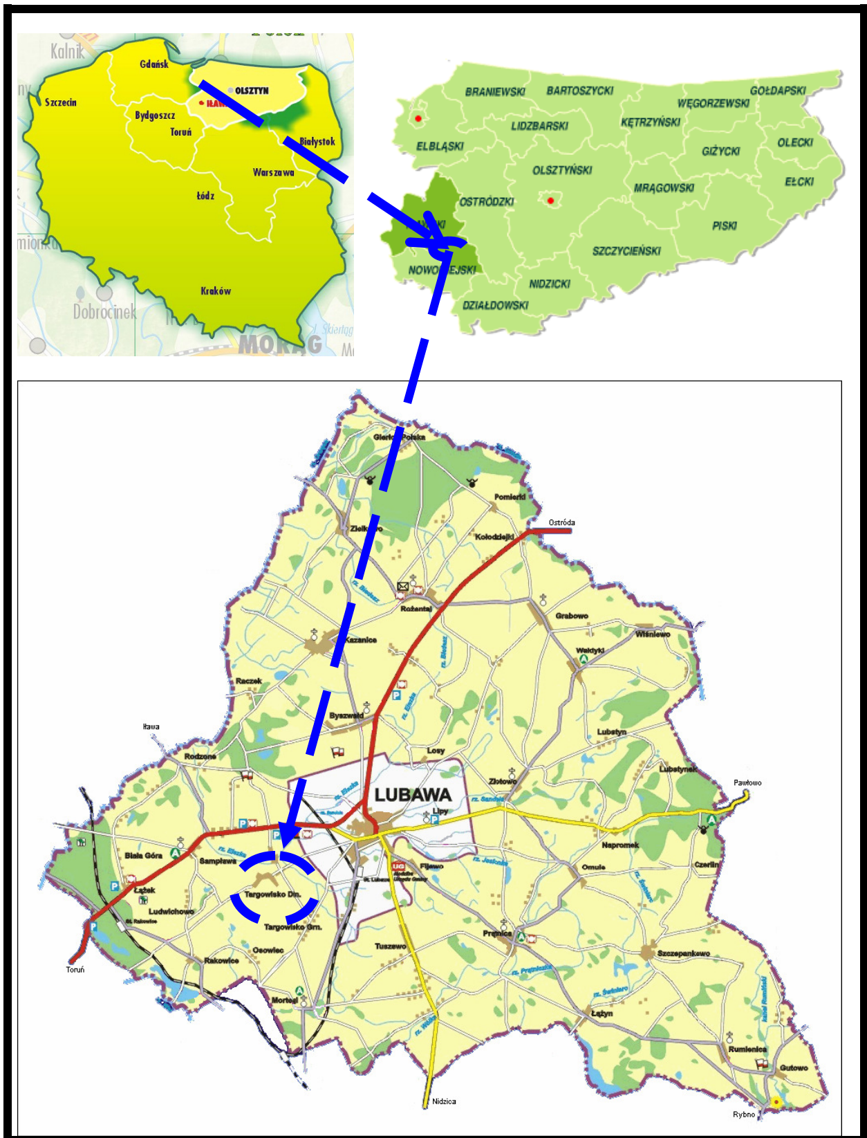
Rysunek nr 1 LOKALIZACJA WSI TARGOWISKO DOLNE

Pod względem historycznym, geograficznym i przyrodniczym obszar, na którym położona jest wieś nazywany jest Ziemią Lubawską.