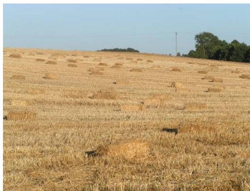
Żniwa w Targowisku Dolnym

Rolnicy w pełni wykorzystują nowe możliwości jakie stwarza członkostwo Polski w Unii Europejskiej i otrzymuje dopłaty bezpośrednie do produkcji rolnej.