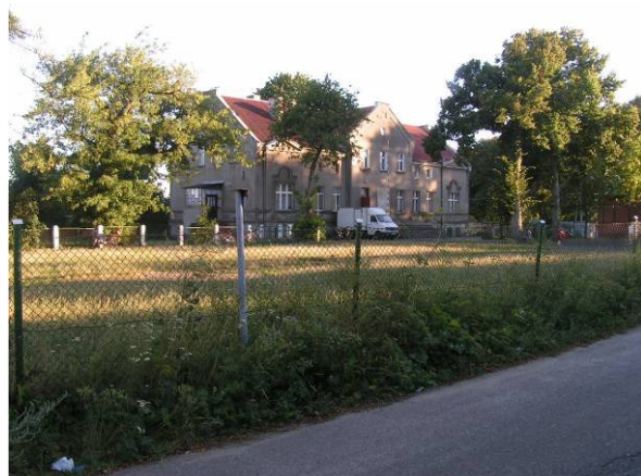
Budynek dawnej szkoły. Dziś są tu mieszkania komunalne.

Do roku 2004 w Targowisku Dolnym była szkoła podstawowa. Została ona zlikwidowana, a budynek zagospodarowano na mieszkania komunalne. Od tego czasu dzieci uczą się w Zespole Szkół w Samplawie oddalonej o 3 km. Jest tu klasa zerowa, szkoła podstawowa oraz gimnazjum. Uczniowie są dowożeni na zajęcia autobusem szkolnym. Nieliczni najmłodszy – 3 osoby, uczęszczają do przedszkola w Lubawie.