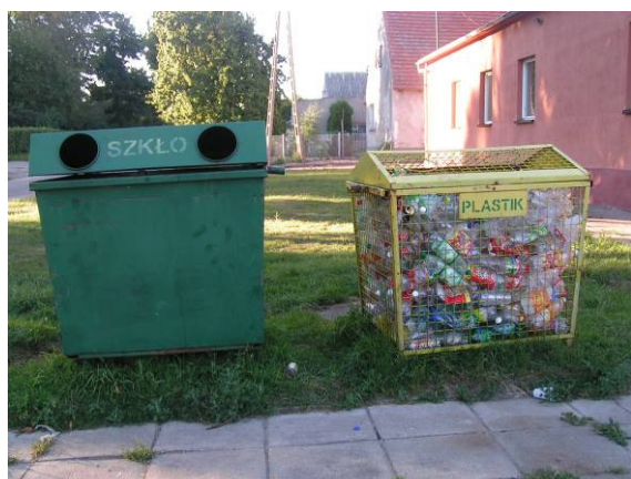
Jedno z trzech stanowisk do selektywnej zbiórki odpadów

W Targowisku stosuje się selektywną zbiórkę odpadów. Na terenie wsi stoją pojemniki na szkło i plastik. Są trzy stanowiska, ale zdaniem mieszkańców powinny być jeszcze dwa.