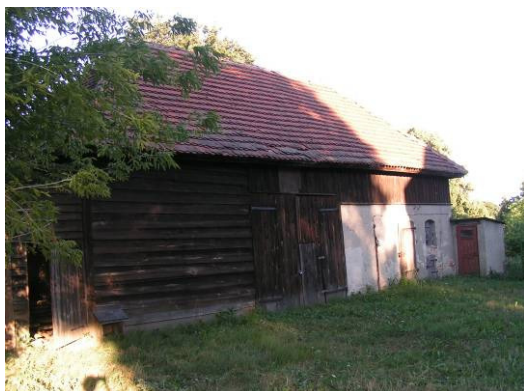
Stara stodoła – w przyszłości „muzeum” i pracownię rękodziela

Ponadto społeczność wiejska powróciła do starego zwyczaju sadzenia drzewek na wiosnę. Tradycja ta wygasła ok. 25 lat temu. Teraz, tj. w kwietniu 2006 r. została wznowiona, a mieszkańcy zamierzają ją kontynuować.