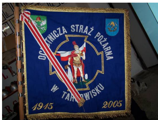
Sztandar OSP z okazji 90-lecia

W Targowisku działa Ochotnicza Straż Pożarna (OSP) o bardzo bogatej tradycji. W roku 2005 OSP świętowała 90-ciolecie istnienia. Już od lat przedwojennych OSP stanowiła Targowisku centrum życia wiejskiego Organizowała zajęcia i zawody dla dzieci, młodzieży i dorosłych, bale, festyny itp. Obecnie jednostka zrzesza 23 członków czynnych, 10 członków młodzieżowej drużyny żeńskiej i 10 drużyny męskiej w wieku do 16 lat.