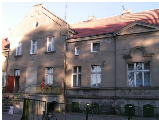
Dawny pałac i szkoła. Obecnie mieszkania komunalne.

W lipcu i sierpniu 2006 r. Rada Sołecka zrealizowała projekt pn. „Wakacje z historią