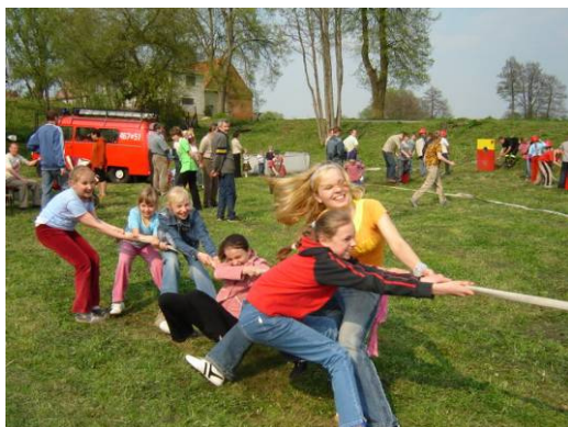
Młodzież na Pikniku Strażackim